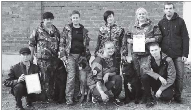
С «Благодарностями» от УВД Первоуральска

– Вот взять этот случай, о котором вы рассказали. На поиски пожилого человека были брошены незначительные ресурсы. На месте работал отряд «Сокол», съехались добровольцы со всей области, родственники пропавшего помогли... Почему все-таки не нашли человека?