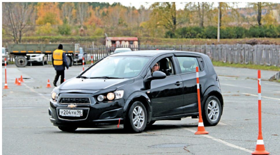
«Змейка» – одно из самых сложных заданий этапа «Фигурное вождение автомобиля».

Участники отлично справились с заданиями, подтвердив своё, пусть и молодое, но тонкое водительское искусство. А после того, как завершили практическую часть соревнований, признавались, что отдельные испытания дались им весьма