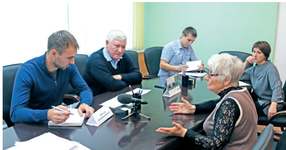
Личный приём горожан стал завершающим этапом рабочей поездки.

и инвентаря, полученного по национальному проекту «Культура».