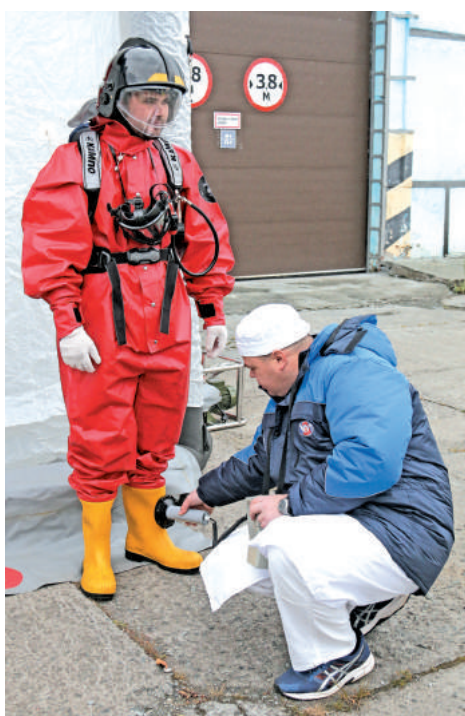
Сотрудник 048 отдела градообразующего предприятия проводит контроль поверхностного альфа-загрязнения.

Утром 1 октября в специально созданном штабе, который работал в здании городской администрации, состоялось заседание комиссии по предупреждению и ликвидации чрезвычайных ситуаций и обеспечению пожарной безопасности.