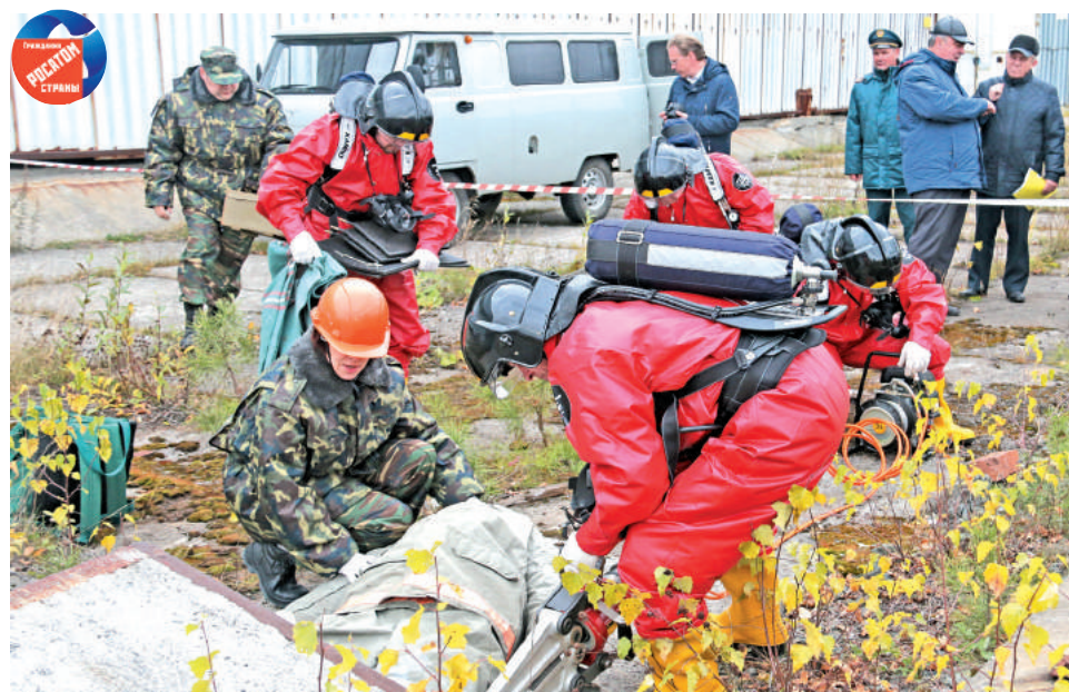
Нештатный аварийно-спасательный отряд комбината «Электрохимприбор» проводит извлечение человека (манекена) из-под железобетонной плиты.

В тот же день на базе аварийно-спасательного формирования (058 отдел комбината «Электрохимприбор») было проведено развёртывание специальной техники и средств. Главе Лесного Сергею Черепанову, заместителю главы города по режиму и безопасности Евгению Кынкурову, начальнику СУ ФПС № 6 МЧС России Алексею Дощенникову, сотрудникам городской администрации были показаны комбинированная радиостанция, позволяющая обеспечивать радиосвязь на стоянке и в движении со скоростью 40 км/ч, комплект аварийно-спасательного гидравлического инструмента для ведения спасательных работ в зонах чрезвычайных происшествий, пожаров, при авариях на транспорте, катастрофах.