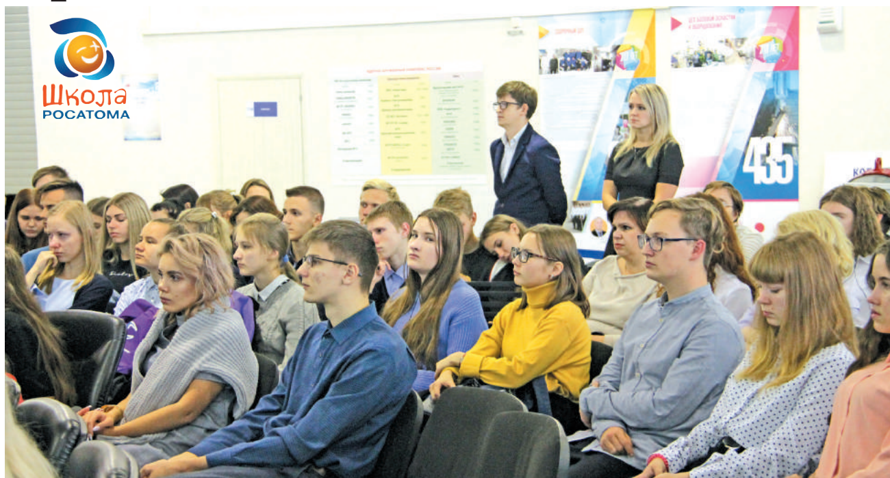
Единый урок «ПроАтом» посетил более шести сотен старшеклассников.

вершить подъём по карьерной лестнице, рассказал, что на сегодняшний день на предприятии с нетерпением ждут в свои ряды инженеров конструкторско-технологического обеспечения машиностроительных производств, знатоков информатики и вычислительной техники, электроэнергетики и элек-