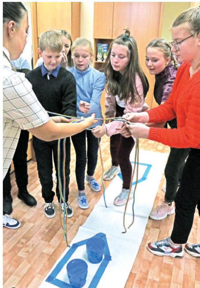
Игры на сплочение и взаимопонимание помогают сдружить ребят, учат их чувствовать и понимать каждого, а также достигать своих целей и не сдаваться.

Что ж, фестиваль «Выше радуги» успешно стартовал. И есть все основания верить, что этот юбилейный для образования Лесного учебный год вновь станет для юного поколения ярким, интересным и главное – результативным.