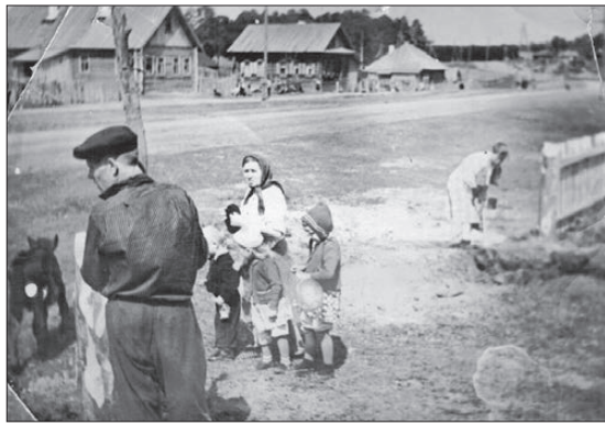
Закладка сада, 1 мая 1959 г.