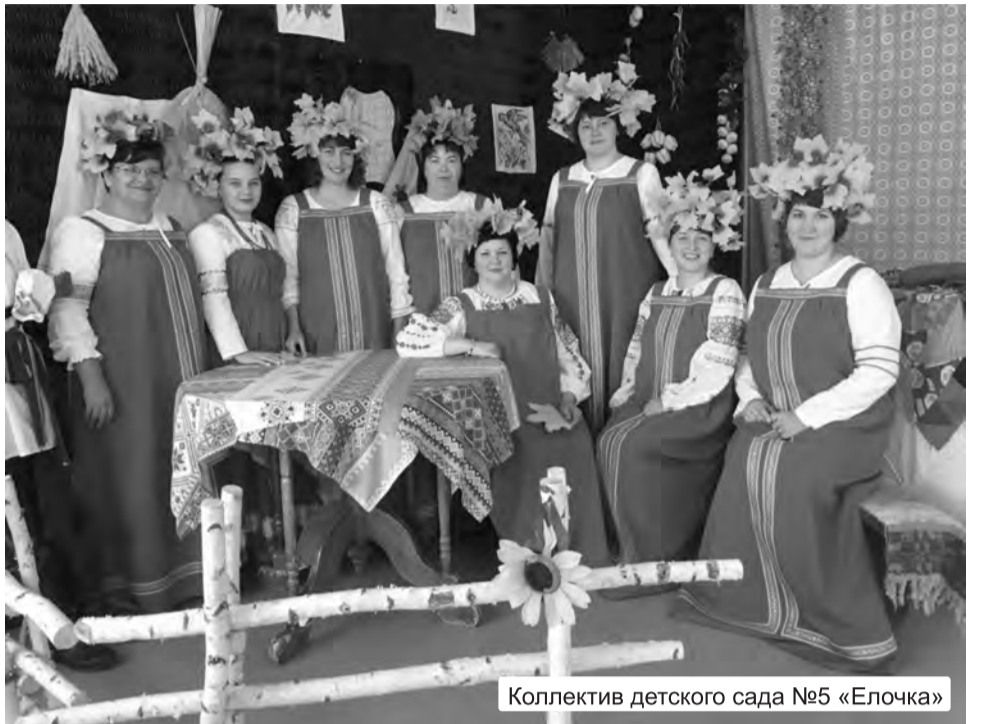
Коллектив детского сада №5 «Елочка»

Быстро перестроиться на новую систему очень сложно. Детские сады испытывают кадровые трудности. Часто и материально-техническое обеспечение не на должном уровне. Но мы все равно, пусть и небольшими шагами, но стремимся к такой модели работы с детьми, где много разговаривают с детками, говорят именно о том, что им интересно, что побуждает к изучению нового, когда приветствуется индивидуально-личностный подход к каждому ребенку.