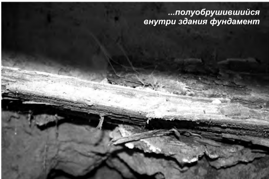
...полуобрушившийся внутри здания фундамент

лые доски и полуобрушившийся внутри здания фундамент.