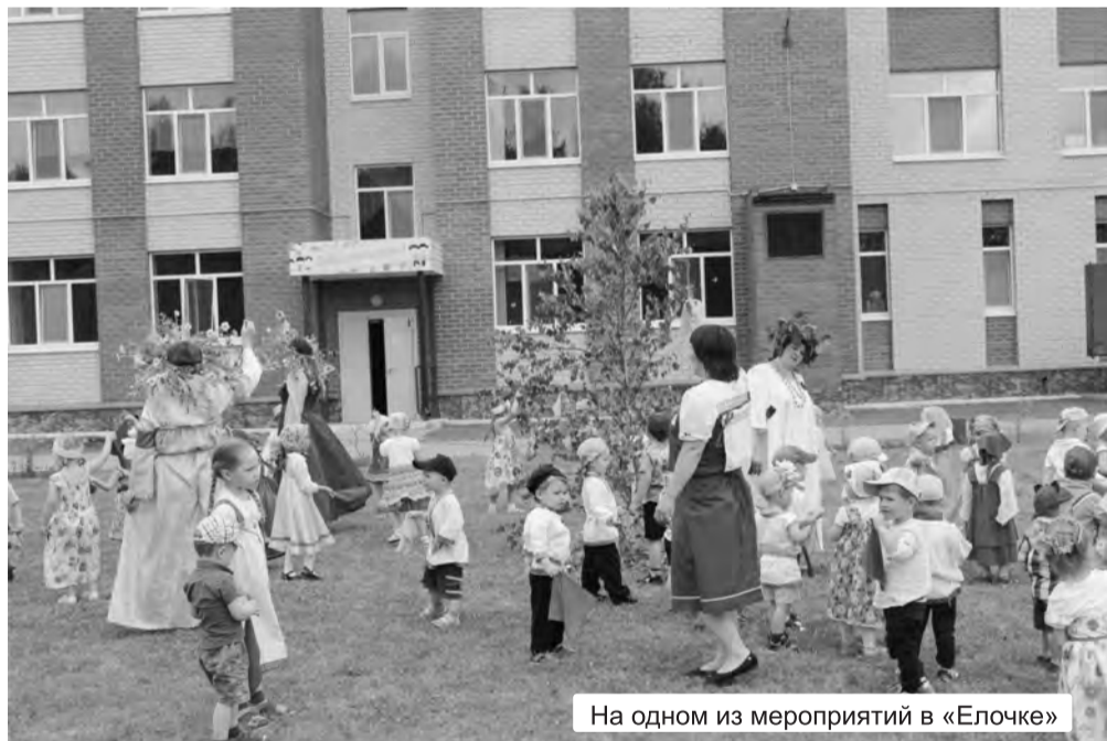
На одном из мероприятий в «Елочке»

Беседовала Алена Булатова