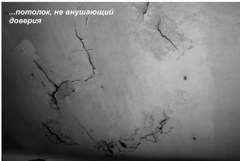
...потолок, не внушающий доверия