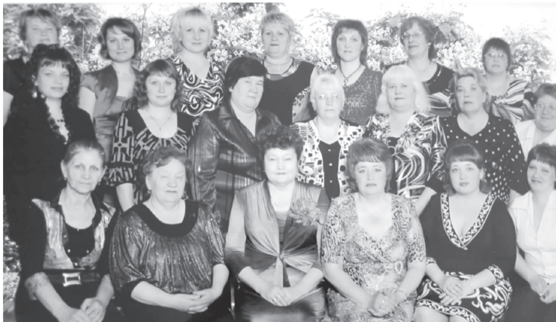
«8 лет назад...». Коллектив детского сада «Тополек».

Для тех, кто хочет вспомнить о своих детсадовских годах и своих вторых мамах, вкус манной каши и молока с пенкой с утра, веселых утренниках, Дедов Морозов в папиных ботинках — фотомарафон от коллективов детских садов и редакции газеты «Сельская новь». Вернемся! Назад, в детский сад!