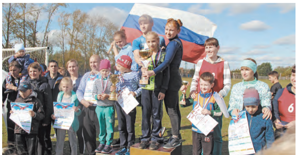
Награждение семей, пос. Троицкий

Закрытием сезона лёгкой атлетики станет «Осенний кросс». 28 сентября школьники смогут показать свои результаты на территории Ургинского пляжа. Приезд участников в 10-00, торжественное открытие в 10-30, старт в 11-00. Параллельно с проведением соревнований будет осуществляться прием норматива Всероссийского физкультурно-спортивного комплекса «Готов к труду и обороне» - «Бег по пересеченной местности».