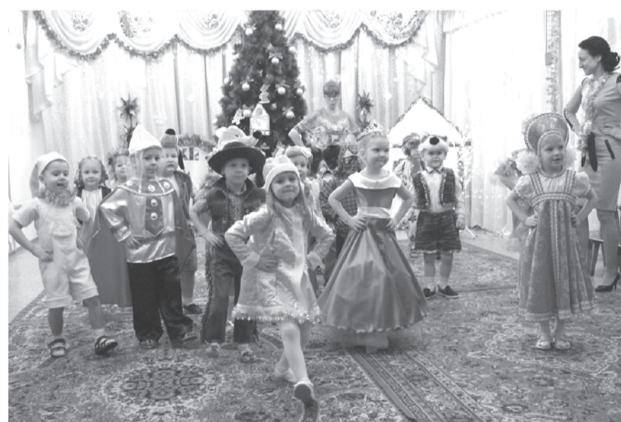
«Веселые садовые будни»