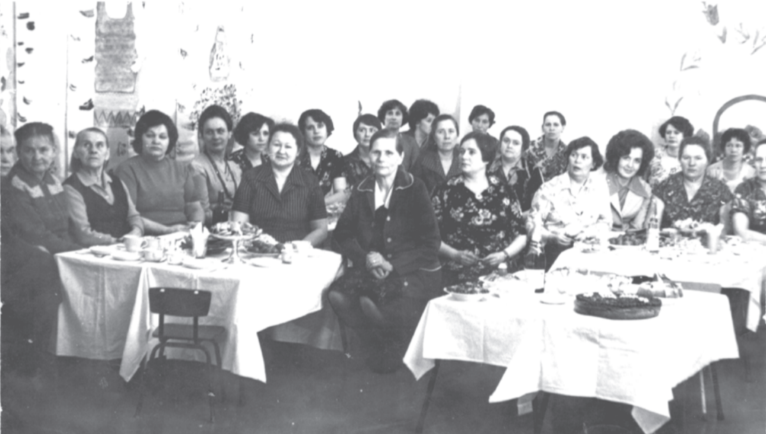
1981 г. Юбилей детского сада им. 1 мая (20 лет).