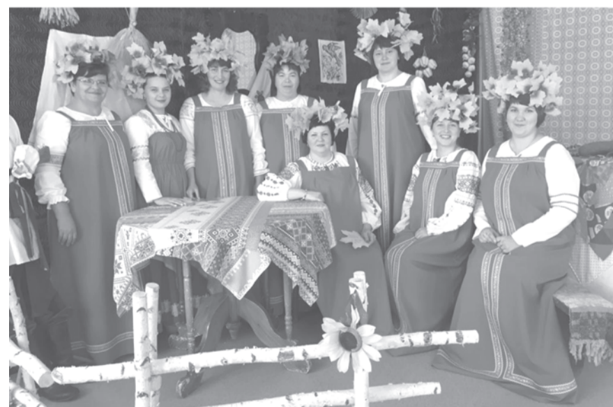
Воспитатели детского сада № 5 «Елочка»