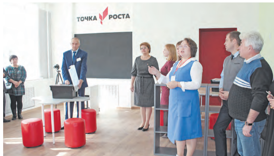
Открытие «Точки роста» в Пионерской школе