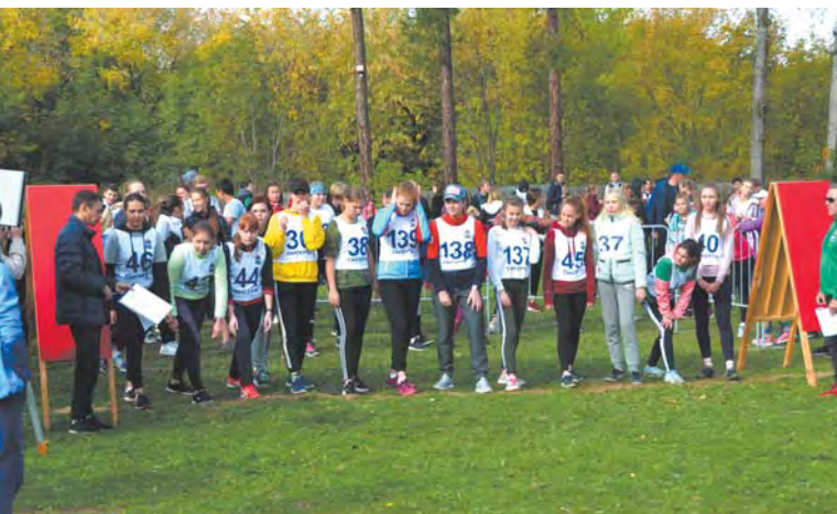
Стартуют девушки старшего возраста. Дистанция – 1 километр. Это первый забег, будет еще второй.

Команда школы 18 из поселка Октябрьский была одной из самых многочисленных