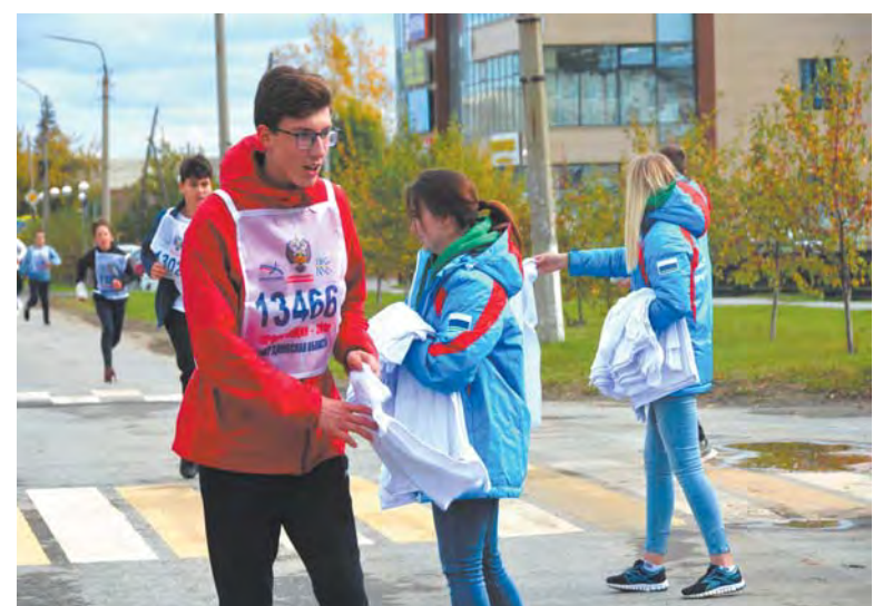
На кроссе была, но не бежала, а только снимала Надежда Шаяхова