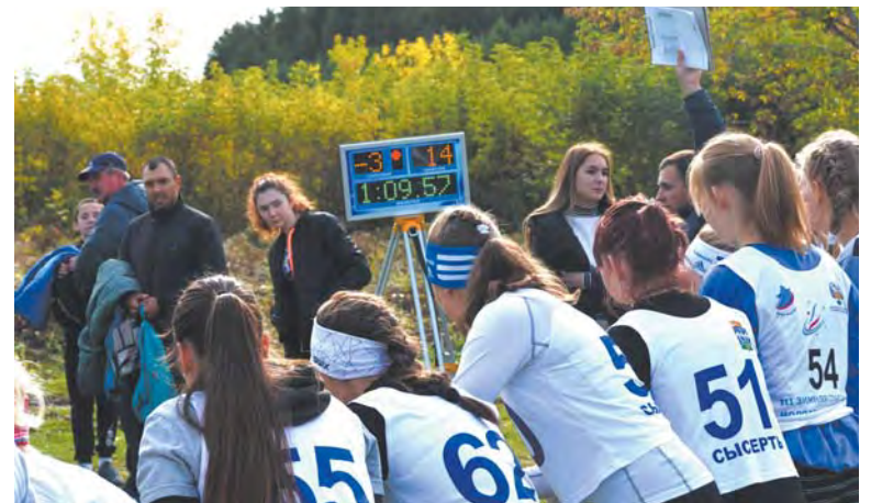
Через мгновение – старт!