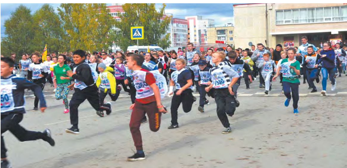
В 13 часов на площади перед городским центром досуга состоялся главный старт «Кросса наций» - массовый забег на 2,5 км. В нем принимали участие порядка 2 тысяч школьников и жителей города.

Сильнейшие в массовом забеге на финише получали футболки из рук девушек – волонтеров. Все – памятные значки и ручки.