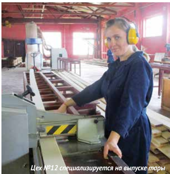
Цех №12 специализируется на выпуске тары