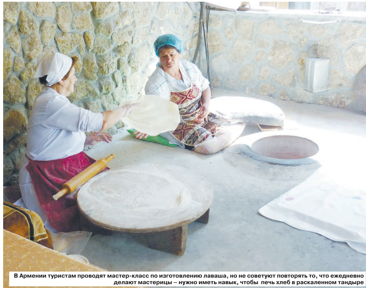
В Армении туристам проводят мастер-класс по изготовлению лаваша, но не советуют повторять то, что ежедневно делают мастерицы – нужно иметь навыки, чтобы печь хлеб в раскаленном тандыре

– Для приготовления коньяка используются местные сорта винограда. Всего используется более 10 сортов, произрастающих в Араратской долине. Это Воскеат, Гарандамк, Чилар, Мсхали, Кангун и Бананц, Кажет, Мехали. После сбора виноград отправляют на отжим, заторон он проходит так называемую винификацию. Полученное в процессе молодое вино уже считается виноматериалом, который отправляют на ди-