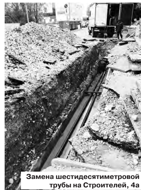
Замена шестидесятиметровой трубы на Строителей, 4а

В выходные МКУ «Благоустройство и ЖКХ» совместно с «Водоканалом» вышли на устранение аварии на тепломагистрали в сторону Строителей, 4а. К вечеру воскресенья работы были завершены, было заменено 60 метров трубы. Были проблемы в двух детских садах: детский сад №39 с сегодняшнего дня работает, завтра откроется садик на Циолковского.