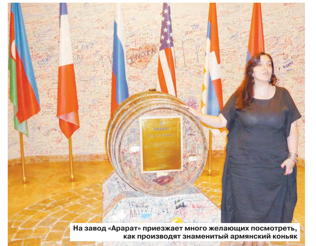
На завод «Арарат» приезжает много желающих посмотреть, как производят знаменитый армянский коньяк