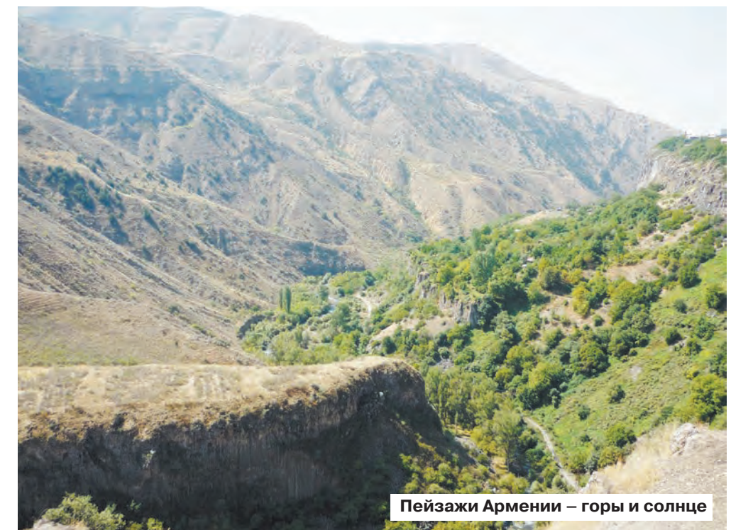
Пейзажи Армении – горы и солнце