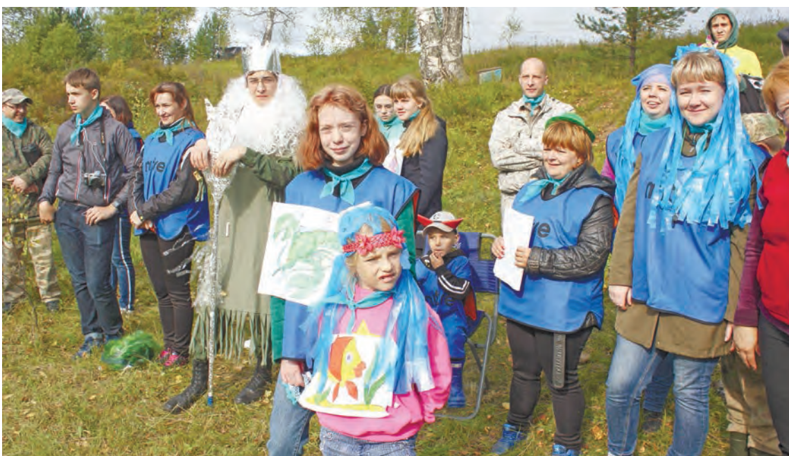
Команда Интерлок показала на презентации сказку про Нептуна