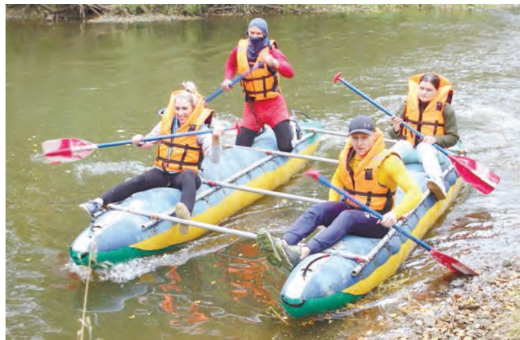
Водную дистанцию проходит команда фабрики обогащения