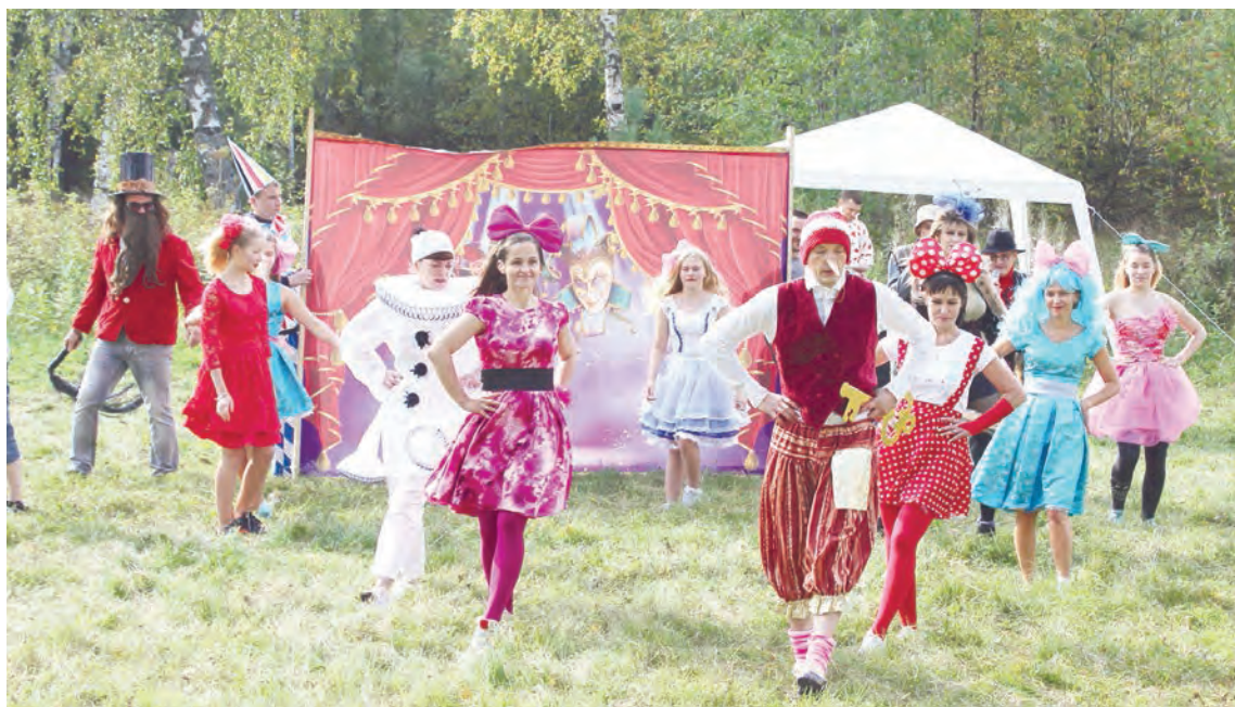
Выступление театра «Евраз Карабас», команда ТЭЦ