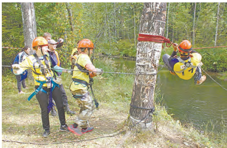
Контрольно-туристический маршрут проходит команда УКП