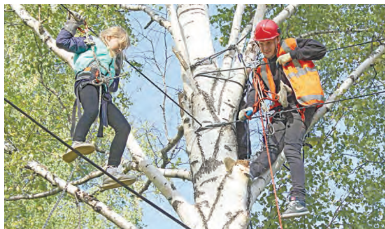
После того, как команды завершили прохождение спортивной дистанции, попробовать силы на этапах могли все желающие