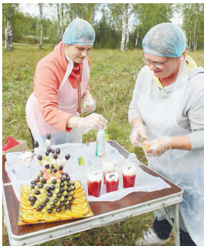
Для приготовления арбузного фреша команда фабрики обогащения привезла с собой генератор и блендер