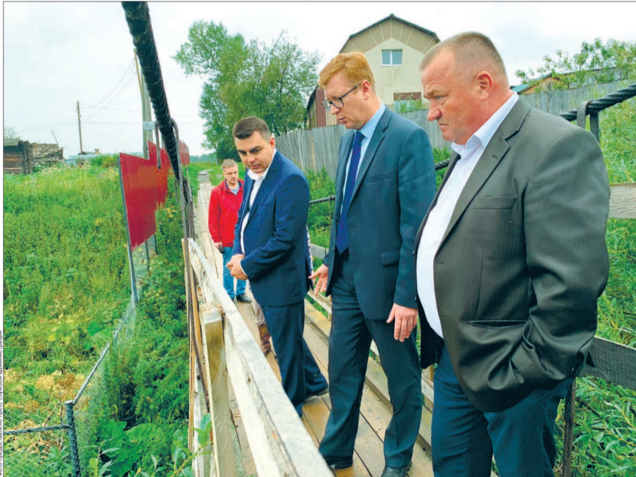
Слобода. Решение о том, что делать с мостом, принимали на месте

Состоялся очередной прием граждан по личным вопросам главой города. На этот раз он проходил в Новоуткинске. И не ограничился стенами кабинета. Можно сказать, что прием перерос в оперативное выездное совещание.