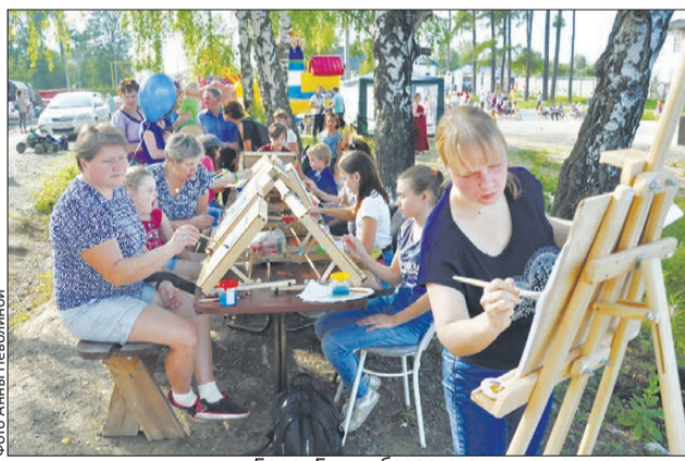
Берег Билимбаевского пруда просто создан, чтобы стать сюжетом картины

Правленский сад — это достопримечательность поселка, появившаяся благодаря Строгановым, одно время заброшенная и сейчас возрождаемая. В субботу он был занят весь день, до позднего вечера. Сразу было трудно сориентироваться, что выбрать? Мастер-классы от Строгановской школы искусств и ремесел? Или выставку казачьего оружия? А, может, заглянуть на подворье, за пряхкой по-