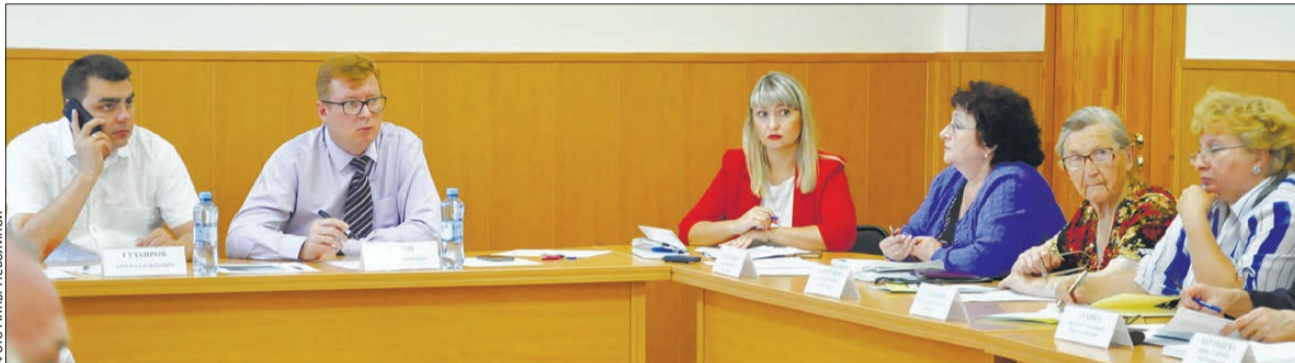
Совещания с председателями уличных комитетов проходят в режиме диалога

Первая неделя августа началась с обсуждения насущных вопросов частного сектора. Глава городского округа провел заседание с председателями уличных комитетов. В повестку было включено 35 вопросов, охватывавших все сферы – от наружного освещения до экологической реформы по обращению с ТКО. Как всегда, в работе совещания участвовали представители администрации и приглашенные специалисты.