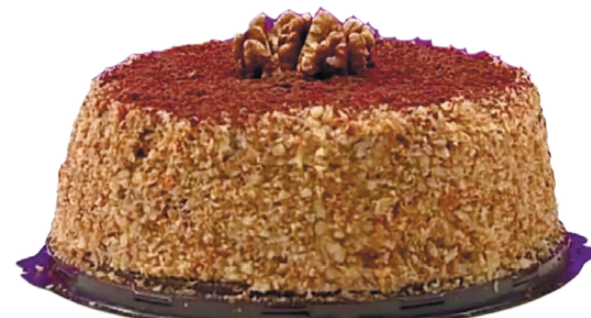
Торт «Царское угощение»: вполне самодостаточно и без изысков декора. Проверено!