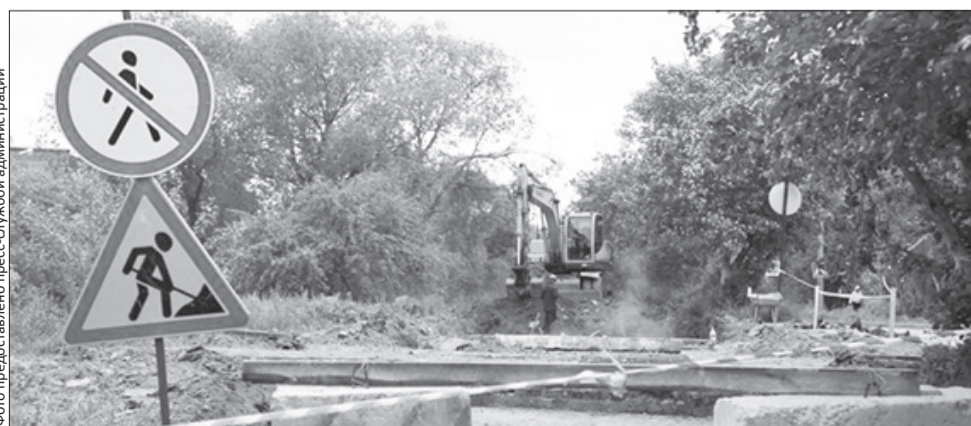
Летний пейзаж, чтобы не мерзнуть зимой