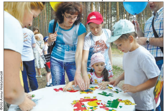
Задание подстать празднику: составь герб города

На небольшой эстраде рядом с зоопарком выступал фокусник. Были фокусы с кольцами, веревочками, возникающими из воздуха платками, но зрителей больше всех поразил номер с сотенной купюрой. Ее вытащили из серединки лимона! Свернутая купюра, которую подали сами зрители, оказалась насквозь пропитана соком. Фокуснику осталось только оплести ее номер, который был объявлен заранее, чтобы не возникло подмены. К восторгу зрителей, номер совпал!