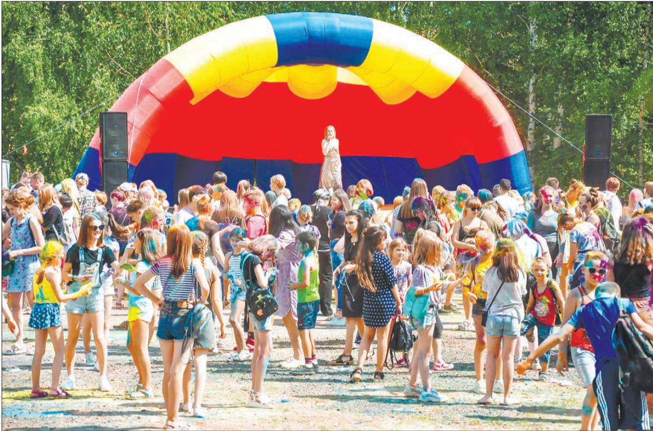
На вертолетной площадке танцевали и бросались краской

– Здорово! Кидаться впервые попробовал, друзья посоветовали, – доволен перепачканный разноцветным порошком пятиклассник школы №1 Денис Рамазанов. – Это в других городах есть, теперь и у нас.