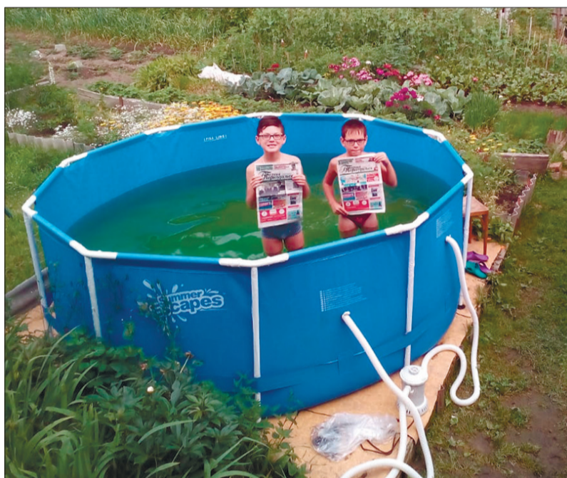
«Пресса, воздух и вода – наши лучшие друзья»