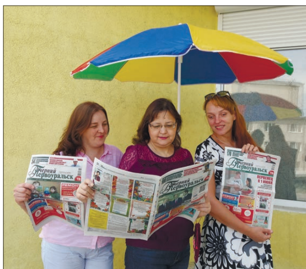
С «Вечеркой» – всегда хорошая погода