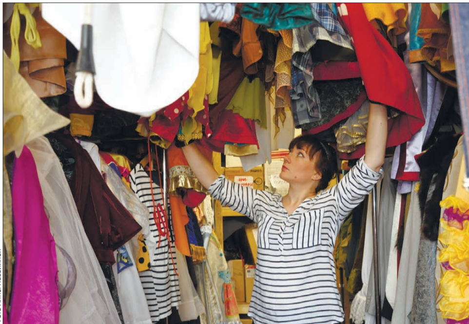
Поднимаешь голову, а перед тобой целая жизнь придворных дам, джентльменов, рабочих, фантастических героев — кого угодно