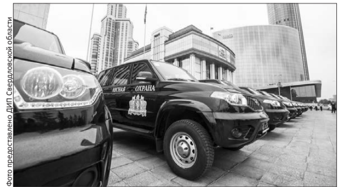
Внедорожник – российской сборки, как и полагается «Патриоту»

Не исключено, что в ближайшие годы за каждым