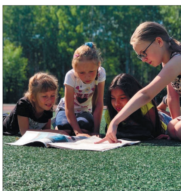
«А что там про каникулы пишут?»