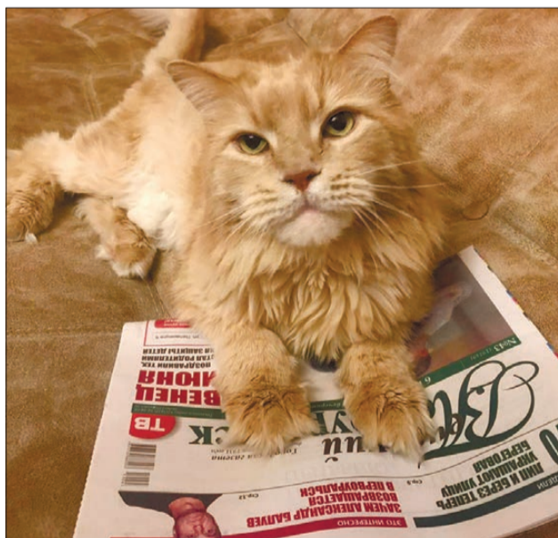
Мейн-кун Бенди: печатное слово и кошке приятно