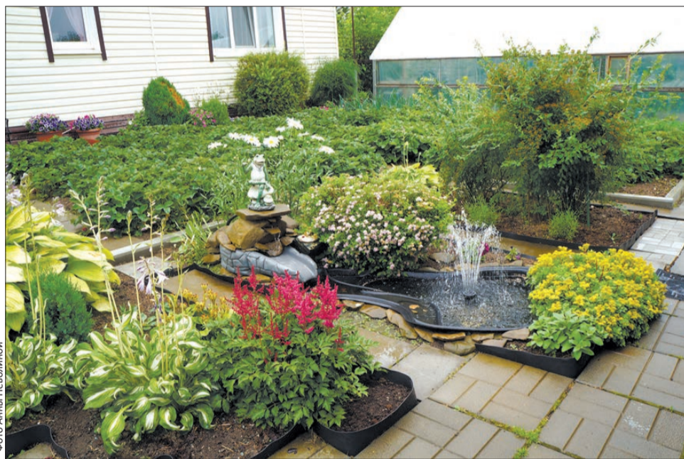
У образцового хозяина найдется место и красоте, и пользе