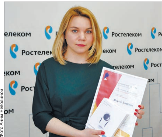
Одним из призов конкурса стала wi-fi — камера для дома