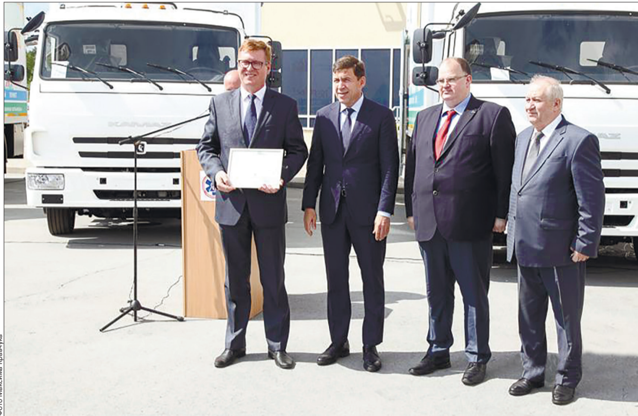
Церемония состоялась на площадке Территориального центра медицины катастроф