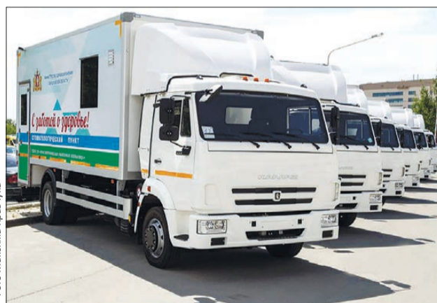
Передвижной спецавтомобиль — полностью организованное рабочее место фельдшера