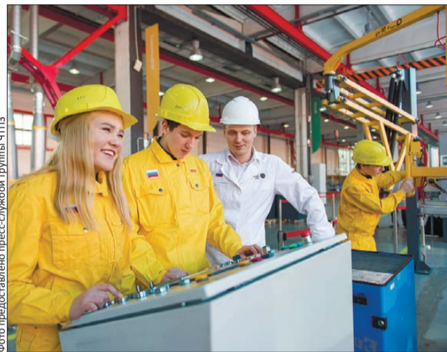
Белая металлургия: профессия становится судьбой

Первоуральск выступит пилотной площадкой по внедрению практики целевого обучения в рамках образовательной программы Группы ЧТПЗ «Будущее Белой металлургии». Проще говоря, студенты смогут уже в начале обучения заключить с предприятием контракт, обеспечивающий им рабочие места сразу после получения диплома.