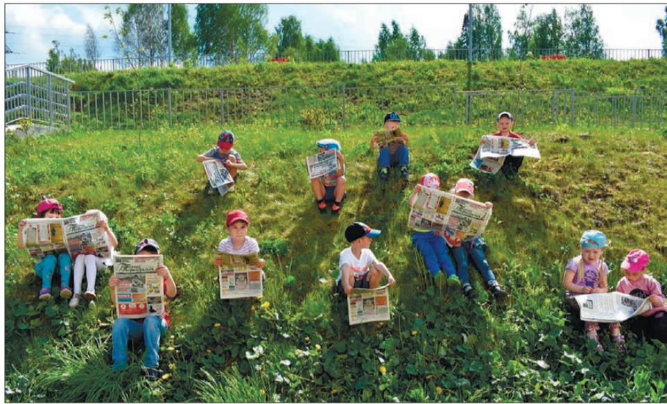
Ребятишки из детского сада №27 решили встретиться с «Вечеркой» теплое летнее утро

Приносите ваши снимки с «Вечеркой» в редакцию (ул. Емлина, 20-б), присылайте по электронной почте: vecher15@yandex.ru