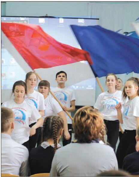
25 марта в Фоминской школе были подведены итоги социально-педагогического проекта «Будь здоров!».

Проект начал свою деятельность как «соревнование классов, свободных от курения». Изначально он был создан для школьников Екатеринбург, но сразу вызвал большой интерес у учащихся из близлежащих городов, и проект получил областной статус. Ежегодно в нем принимают участие порядка семи тысяч подростков – учащихся с седьмого по девятые классы. Девиз проекта - «Здорово быть здоровым!». В 2018 году к проекту подключился и Ирбитский район, педагоги, подростки и их родители поддержали цели и задачи областного проекта. Старт был дан в октябре, в спортивном зале Гаевской школы, участвовали коллективы трех школ Ирбитского района - учащиеся седьмых классов Гаевской и Пьянковской школ и ученики восьмого класса Фоминской школы.