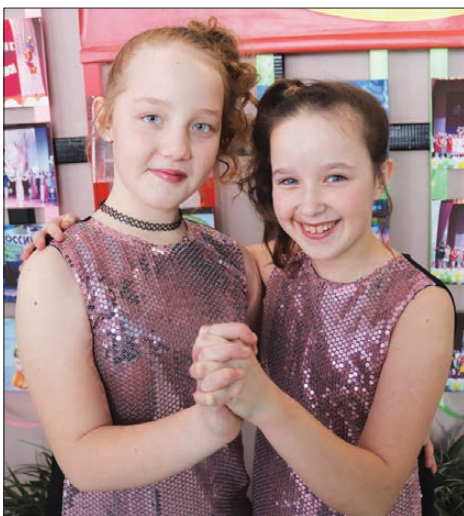
XII открытый районный конкурс исполнителей эстрадной песни «Российские колокольчики» вновь звенел на чернорицкой сцене.

В Чернорицком сельском доме культуры вновь было шумно и весело. В двенадцатый раз в нем прошел открытый районный песенный конкурс юных исполнителей эстрадной песни «Российские колокольчики».