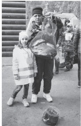
Ребята из арамилевского приюта принимают участие в конкурсе рыбаков