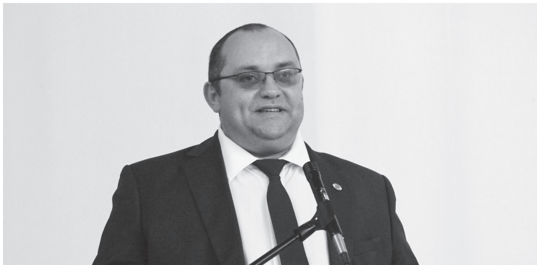
Глава Арамилского ГО Виталий Никитенко.