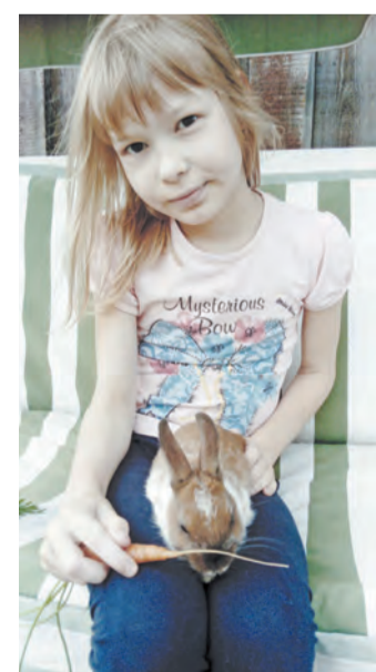
«Я крольчонка обожаю и морковкой угощаю», Фото Н.Г. Зуевой.