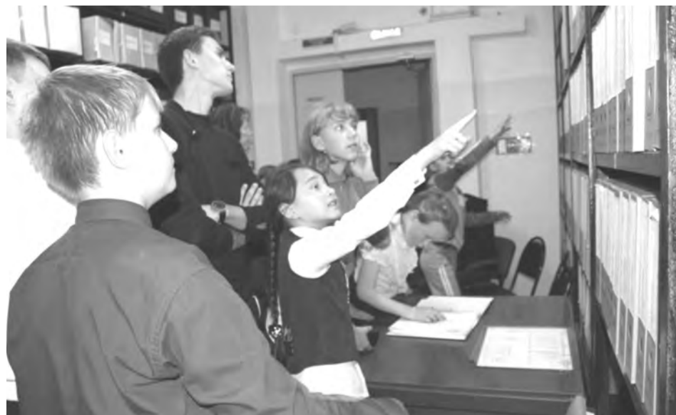
На экскурсии в архиве