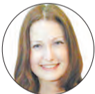
АВТОР ЕКАТЕРИНА ХОЛКИНА

Итоги. Для 1056 выпускников прозвучал последний звонок, за парты сядет 1191 первоклассник