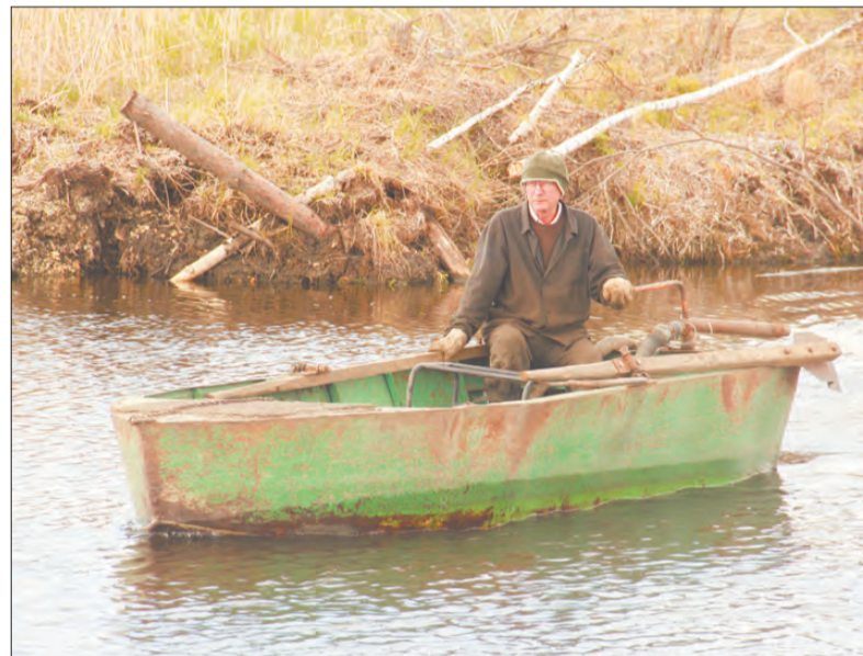
📷 До рабочего места только на лодке

Ширина забоя приблизительно 60 метров. Отработав один, драга зашагивает – продвигается вперед на 2,5–3,5 м для от-