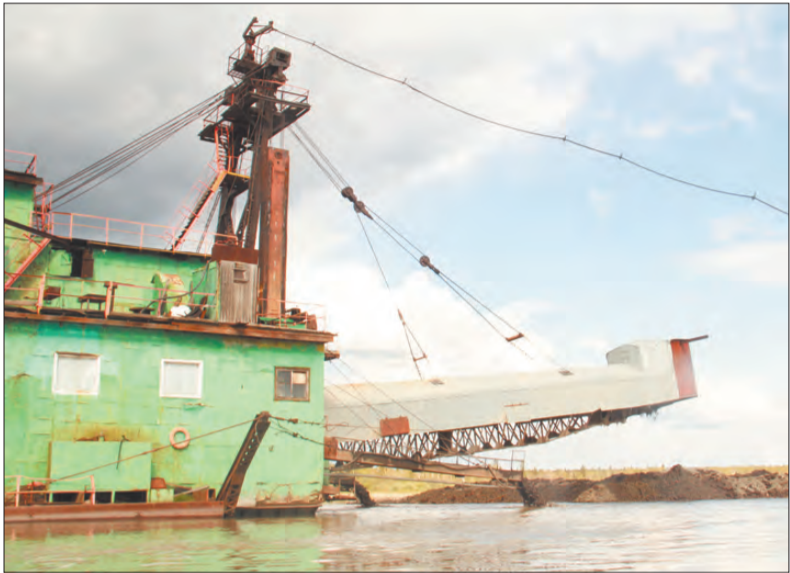
Общий вид, открывающийся с берега. Машина мощная, даже немного пугающая

добывает драгоценный металл на реке Пышме