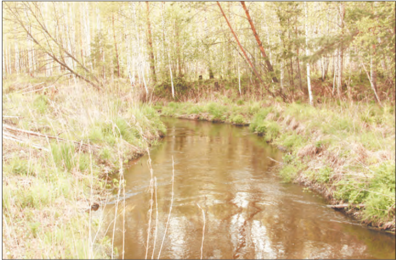
В верховьях и ниже поселка Становая драга давно прошла. Эти земли рекультивировали. По берегам дражных разрезов посажены хвойные породы деревьев, которые хорошо приживаются на отвалах. На многих участках построены коллективные сады и дачные поселки