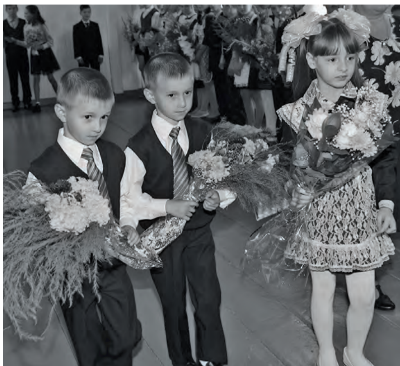
● Первоклассники Киргишанской школы