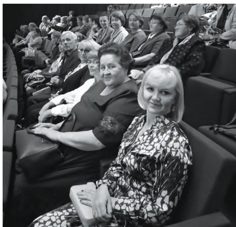
● Бисертская делегация на областной педконференции

- Сегодня, по итогам 2018-2019 учебного года, мы можем констатировать, что усилиями всего педагогического сообщества все обучающиеся 11 классов получили аттестаты о среднем общем образовании.