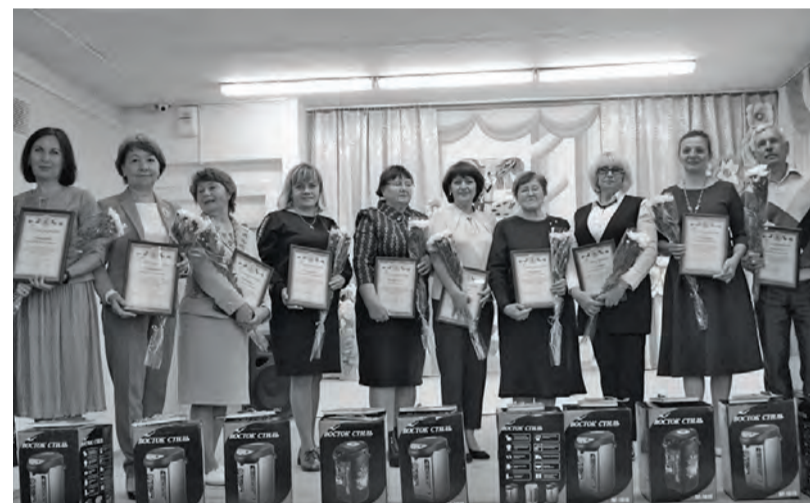
● Руководители учреждений образования Бисертского городского округа

ции девятиклассников перевести во вторую школу.