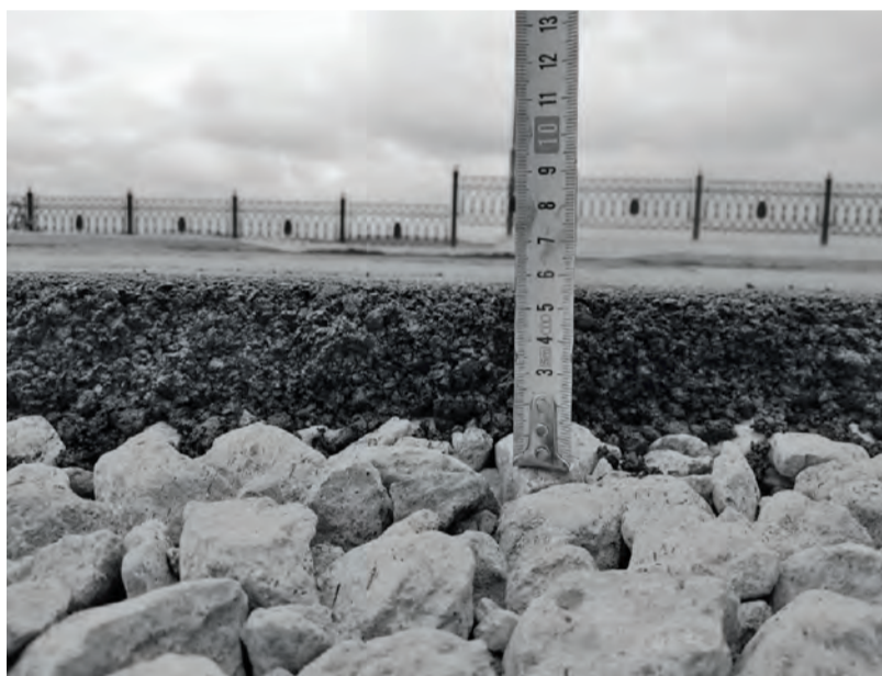
● Контроль уровня уложенного асфальта

домашнего окна, особенно в то смутное безвременье, когда на улице уже похолодало, а в батареях ещё не потеплело.