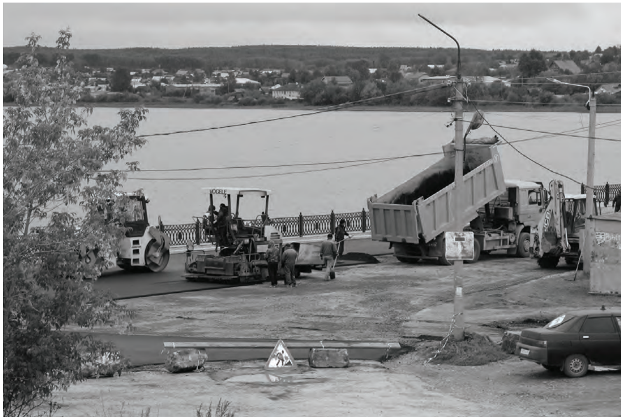
● Начало работ по укладке асфальта на набережной

Холод и влажность суровой уральской осени одинаково неуютно ощущаются по обе стороны