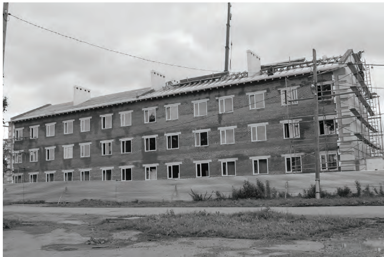
● Строительство нового дома по улице Тимирязева переходит в стадию внутренних работ, установлены стеклопакеты, проводится отделка наружных стен