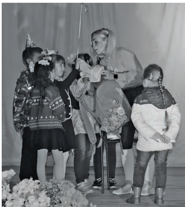
● В День знаний в Доме культуры «Искра» прошло мероприятие для школьников «Весёлая переманка»