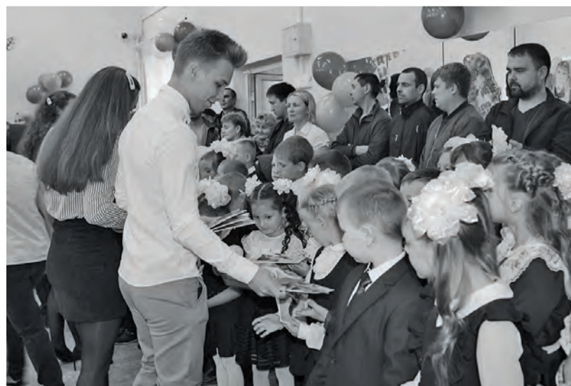
● Школа № 2. Старшеклассники дарят подарки