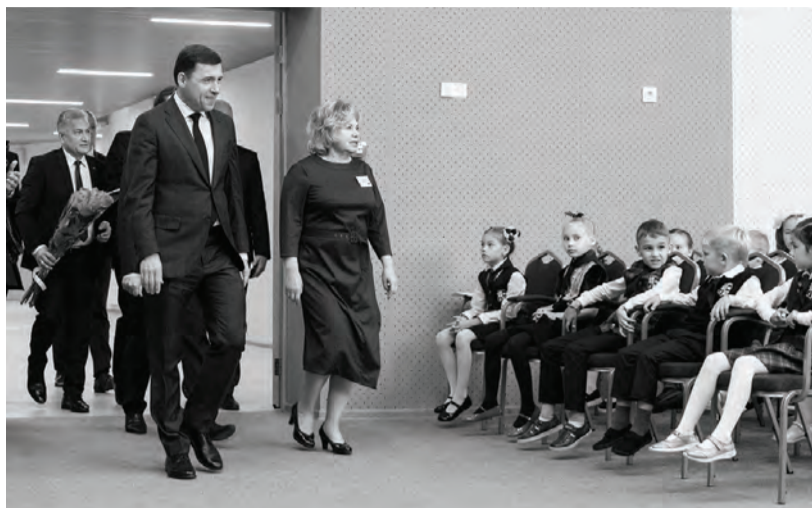
● Евгений Куйвашев в школе на Верх-Исетском бульваре. Екатеринбург

Торжественные линейки, посвященные Дню знаний, прошли в Свердловской области 2 сентября. В школы региона отправились около 500 тысяч юных уральцев, из которых более 55 тысяч ребят пошли в первые классы. Губернатор Евгений Куйвашев поздравил учеников, их родителей и педагогов с началом учебного года на линейке в школе №1, которая была фактически отстроена заново на Верх-Исетском бульваре в Екатеринбурге.