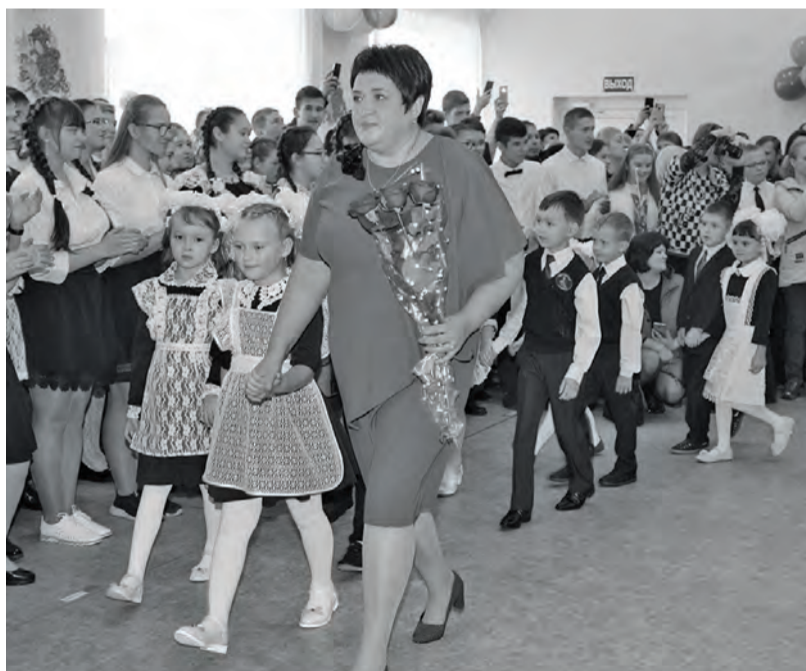
● Школа № 2. Первоклассники идут на торжественную линейку со своим первым учителем