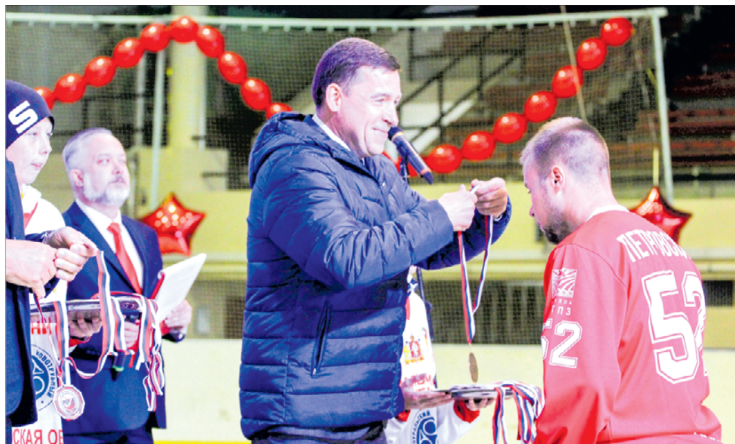
Бронзовые медали чемпионата России первоуральские хоккеисты завоевали впервые в истории. Евгений Куйвашев наградил защитников, нападающих, вратарей и тренеров «Уральского трубника».