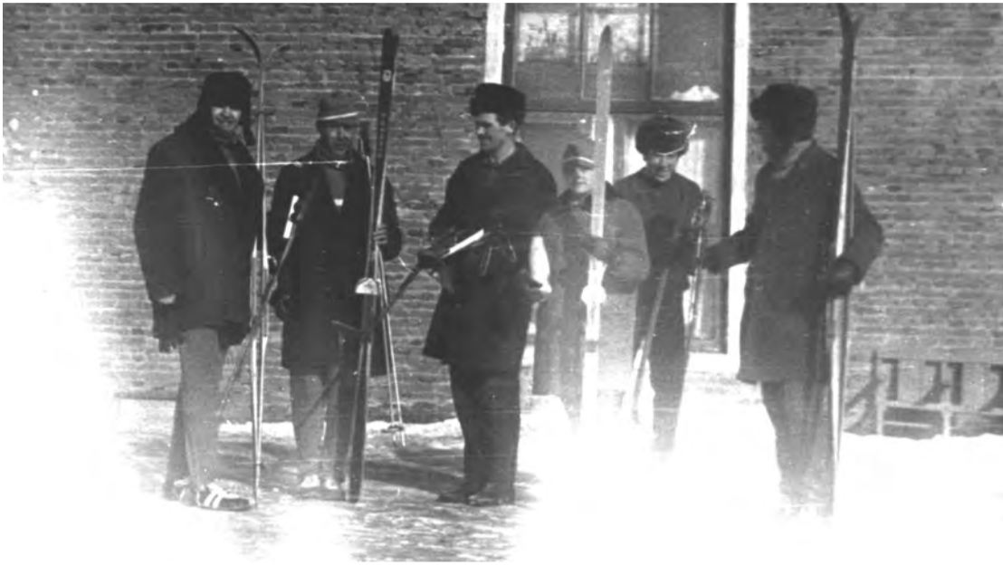
70-е годы. г. Талица. Соревнования по лыжным гонкам.

Каждая фотография должна сопровождаться информацией о том, когда и где она сделана, что на ней изображено (или кто изображен), от кого получена.