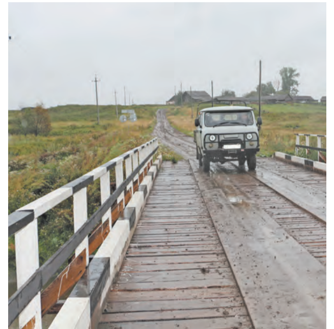
Новый мост обошелся в чуть более 1 миллиона рублей

- Да уж не считаю. Сотни две где-то будет. Поля окашиваем, сено заготовливаем. Раньше и сено продавали, сейчас на него спроса нет. Да и овечью шерсть приходится сжигать, никуда не принимают, производств не осталось.