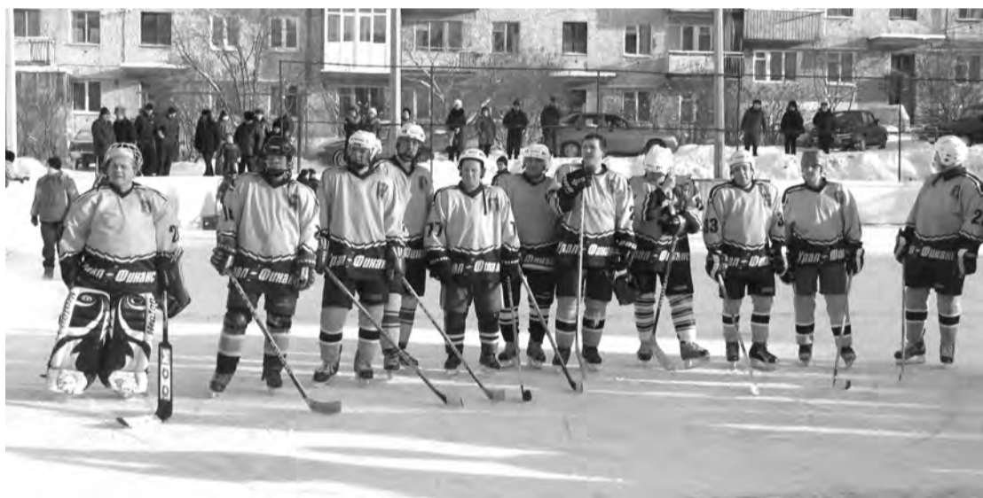
30.01.2007 г. Хоккеисты.