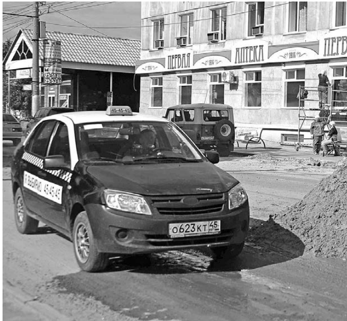
Агрегаторы заинтересованы в сотрудничестве с легальными водителями, которые ездят на машинах с «ашечками» и отвечают за безопасность пассажиров.

Многие уходят в тень вынужденно, поскольку нет простого, понятного и справедливого механизма легальной работы