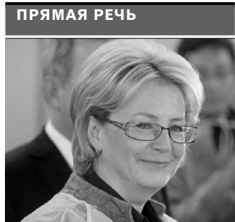
Вероника Скворцова, министр здравоохранения РФ:

На днях губернатор Свердловской области Евгений Куйвашев провел совещание по вопросам здравоохранения. Он поручил провести независимое исследование удовлетворенности уральцев качеством медслужбы, а также выяснить, устраивают ли врачей и средний медперсонал условия труда и зарплата. Профильным ведомством предстоит заняться разработкой обновленной региональной программы развития первичного звена здравоохранения. ●