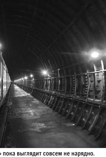
Будущая станция метро «Бажовская» пока выглядит совсем не нарядно.

Екатеринбуржцам нравится идея фуникулера, однако они на поминуту о проектах, презентованных мэрией давным-давно, но так и не реализованных. Например, в ответе скоростного трамвая в Академический: за 12 лет обещаний он так и не появился. ●