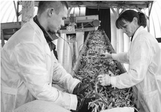
Большинство работающих в цехе — жители окрестных деревень.