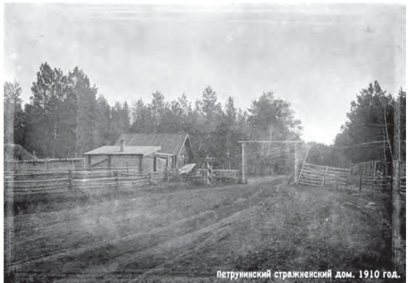
петрунинский стражненский дом. 1910 год.

А красивое название речки Талицы с годами превратилось в малозвучное - Бардянка, т.к. сюда сливались отходы винного производства - «барда». Центром поселения долгие годы являлось пересечение нынешних улиц Ленина и Луначарского. Сама Луначарского уникальна тем, что до революции она имела двойное название: от площади до Петрунихи - Горюшина (были и другие менее звучные названия), а от площади до Пышмы - Вокзальная. В конце 19 века на площади располагалась двухэтажная кирпичное здание Ильинской церкви, построенной при участии заводладельцев