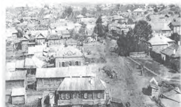
Талицкая заводская слобода (фотография конца 19 начала 20 века)