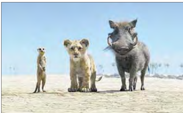
КОРОЛЬ ЛЕВ , 6+ 11:50, 18:00

Возможны изменения. Точное расписание на kzzfun.ru