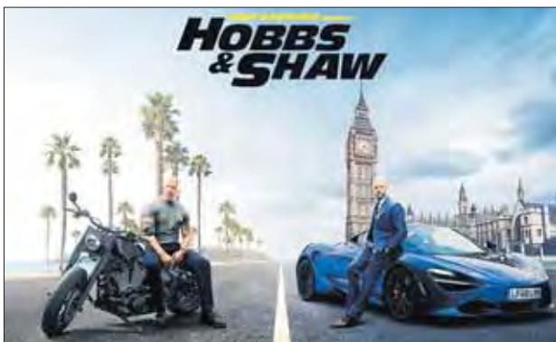
ФОРСАЖ: ХОББС И ШОУ , 12+ 10:00, 15:20(3D), 20:10, 21:50(3D), 22:40

История об отважном львенке по имени Симба. Знакомые с детства герои взрослеют, влюбляются, познают себя и окружающий мир, совершают ошибки и делают правильный выбор.