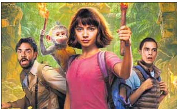
ДОРА И ЗАТЕРЯННЫЙ ГОРОД , 6+ 10:10, 12:10, 14:00, 16:00, 17:50, 19:50