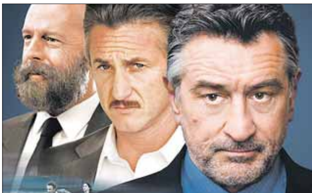
ОДНАЖДЫ В ГОЛЛИВУДЕ , 18+ 12:25, 14:10, 17:05, 20:00, 22:55

Люк Хоббс — американский элитный спецгент, он любит удобную спортивную одежду, большие пикапы и здоровое питание. Декард Шоу — британский пижон, бывший сотрудник разведки, предпочитает дорогие костюмы, спортивные авто и длинноногих красоток. Эти двое ненавидят друг друга. Но если кто-то угрожает их семьям, они готовы пойти на все. Даже на работу в команде.