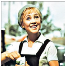
Первый • 15.05 Х/ф «Королева бензokolонки» (12+)