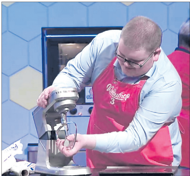
Кадр из шоу «Кондитер» на телеканале «Пятница»

Лучшим из пяти финалистов Вячеслав все же не стал. Но он говорит, что теперь хочет принять участие в шоу вместе со своей одноклассницей — уже в следующем сезоне. Молодой человек планирует активно развиваться дальше, чтобы стать настоящим мастером своего дела.