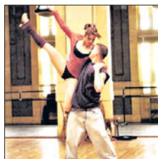
TNT • 18.00 X/ф «Шаг вперед» (12+)