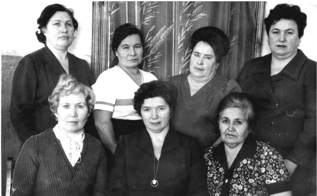
1986 г. 80 лет Талицкому хлебокомбинату. Ветераны труда.