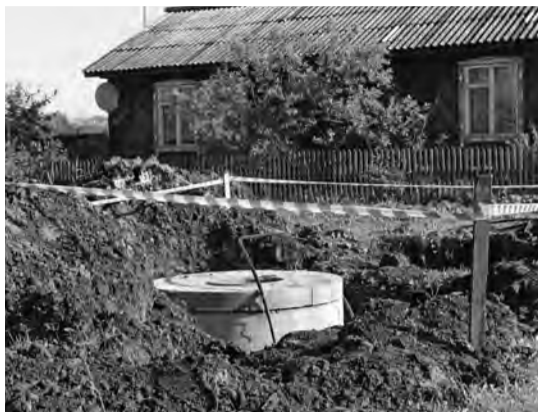
ул. Чкалова, ремонт трассы ХВС.

Тем не менее, вопрос с неработающей колонкой остается открытым. Решить его можно с помощью