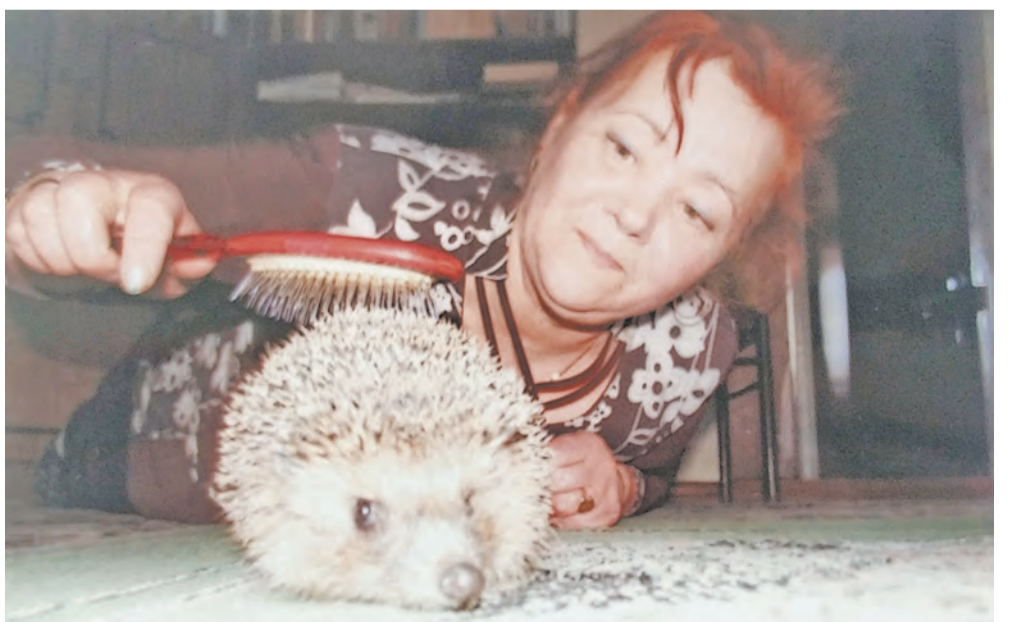
«Мой питомец самый лучший. Не беда, что он колючий. Я колючки причешу. Это нравится ему!».