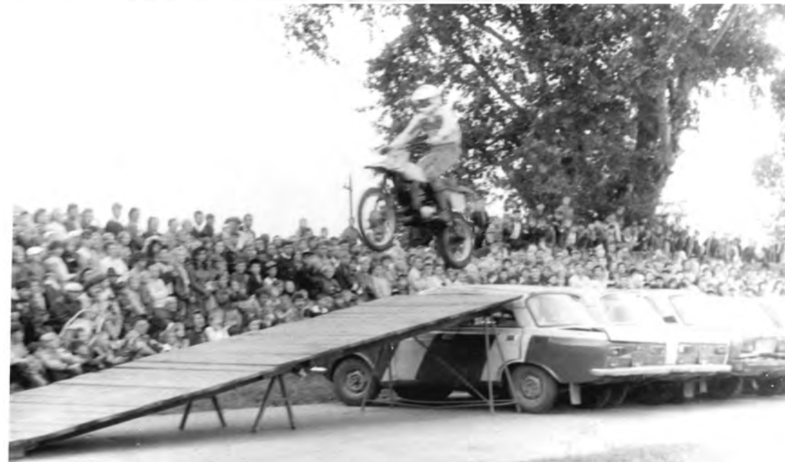
19 августа 1982 г. День города. Московская группа «Автородео» на стадионе БХЗ.