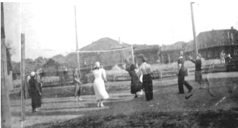
У рабочего клуба. 1936 г.