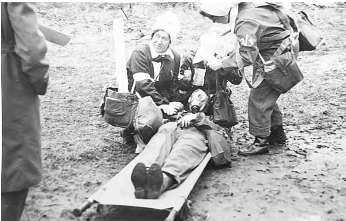
Сандружина от БХЗ, соревнования, 70-е годы