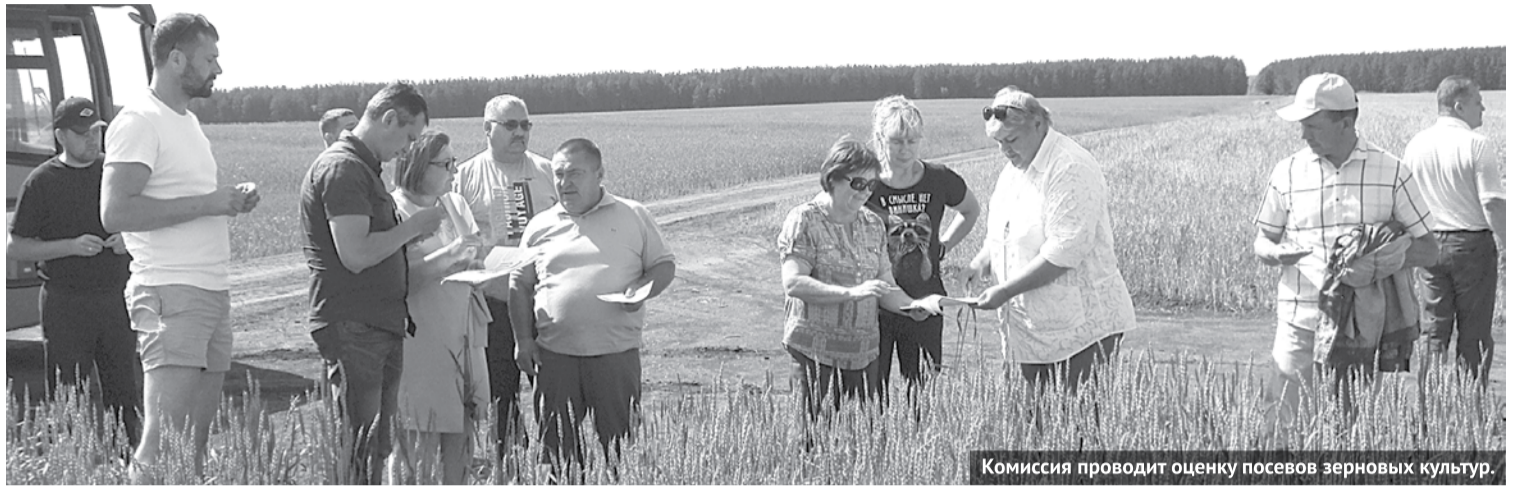
Комиссия проводит оценку посевов зерновых культур.

Состоялся традиционный межрайонный смотр-конкурс «Приемка посевов зерновых культур». Смотр посевов был произведен в десяти хозяйствах Богдановичского и Сухоложского районов