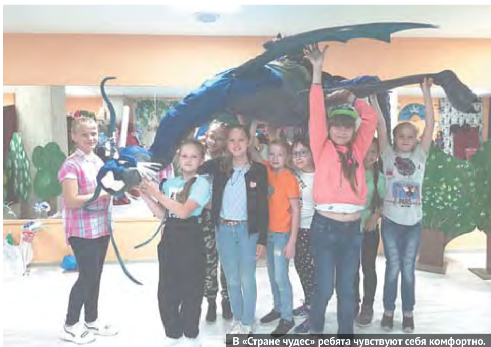
В «Стране чудес» ребята чувствуют себя комфортно.

А в летнем лагере школы №5 «Радуга» состоялся конкурс рисунков на асфальте, в котором ребята придумали и нарисовали на асфальте огромные картины на театральную тематику. В этот день стояла жара. Чтобы спасти художников от нее, приехала пожарная машина, водные процедуры пришлось как нельзя кстати.