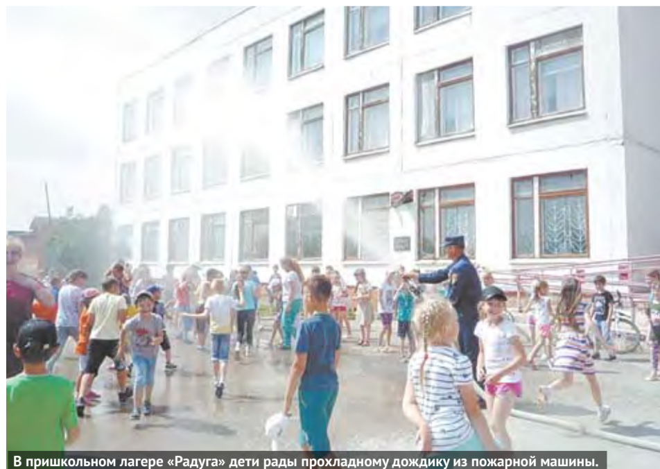
В пришкольном лагере «Радуга» дети рады прохладному дождику из пожарной машины.