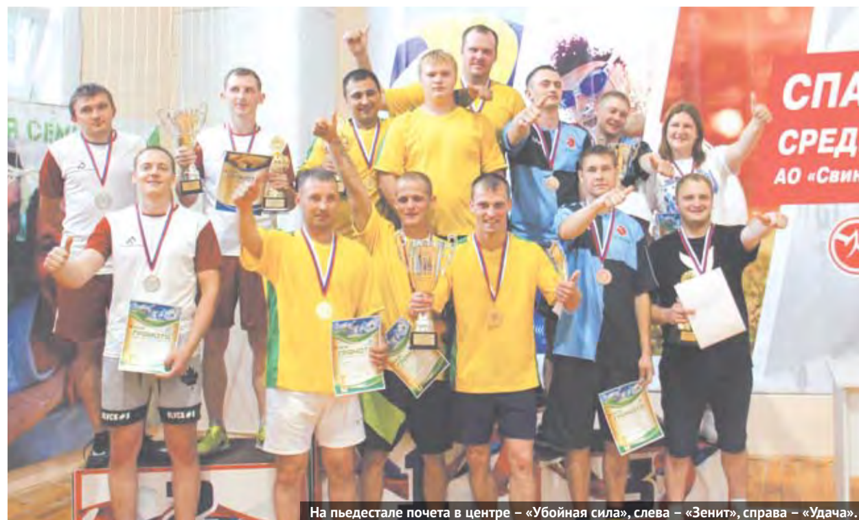
На пьедестале почета в центре – «Убойная сила», слева – «Зенит», справа – «Удача».

В спорткомплексе «Олимп» состоялась традиционная спартакиада среди работников АО «Свинокомплекс «Уральский». В соревнованиях приняли участие четыре команды из различных подразделений: ферма №1 – «Прогресс», ферма №2 – «Удача», команда офиса «Зенит» и цеха убоя – «Убойная сила»