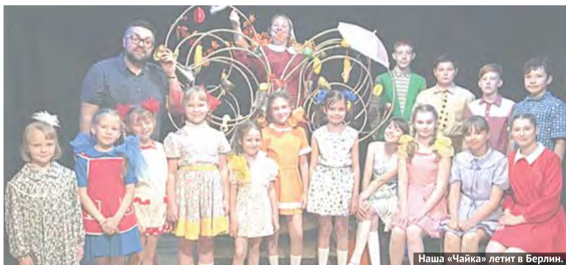
Наша «Чайка» летит в Берлин.

Бесспорно, это волнительно. Не всем предоставляется шанс выступить в международном конкурсе, да еще и за границей. Наша «Чайка» представит спектакль «Чудо-дерево», и, думаю, мы выступим на высшем уровне.