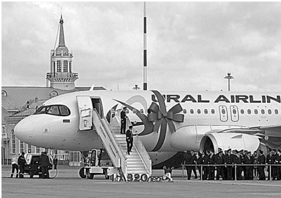
Первый абсолютно новый лайнер пополнил парк «Уральских авиалиний»: раньше компания приобретала только бывшие в употреблении самолеты.

Авиакомпания «Уральские авиалинии» приобрела современный пассажирский лайнер Airbus A320neo и ввела в эксплуатацию вторую очередь производственного комплекса по ремонту и техническому обслуживанию самолетов. Благодаря этому пассажиры смогут без посадки добираться из Екатеринбурга во Владивосток и Хабаровск, рассматривается также возможность организации рейсов из уральской столицы в Токио с одной посадкой. В этом году авиаперевозчик приобретет пять новых лайнеров Airbus. Ввод ремонтного цеха позволит авиакомпании самостоятельно выполнять все виды технического обслуживания узкофюзеляжных воздушных судов европейского производства. Ежегодная экономия оценивается в 130 миллионов рублей.