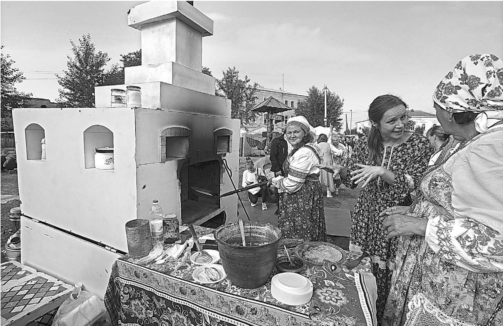
Свыше 400 организаций и тысячи туристов приняли участие в Ирбитской ярмарке. Гости старинного уральского города могли посетить национальные подворья, посмотреть спектакли под открытым небом, поучаствовать в праздничном шествии «Ирбит купеческий» или отправиться на экскурсию в цех, где собирают мотоциклы «Урал». А в местном «Пассаже» разместили 25-метровый макет исторической части города, которую планируют отреставрировать к 2021 году, когда Ирбит и его знаменитая ярмарка отметят 390-летний юбилей.

Подробную информацию можно получить по тел. +7 (495) 909-93-22, доб. 352 и на сайте www.fabrikant.ru , e-mail: goldbenko@usdep.ru