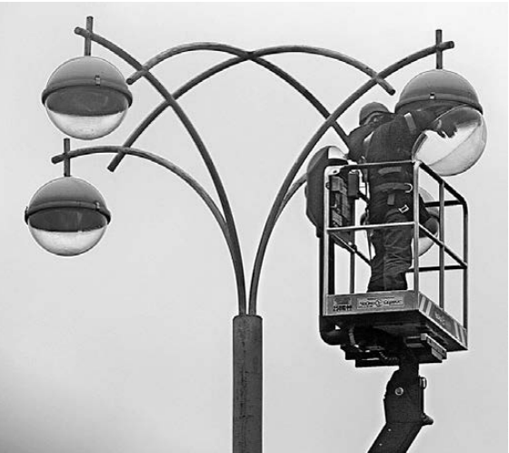
Современные уличные светильники не только экономичнее прежних, но и гораздо эстетичнее.

Помимо очевидных финансовых плюсов на улицах города станет заметно светлее: в фонарях установят светодиодные лампы с оптимальным нейтральным белым светом