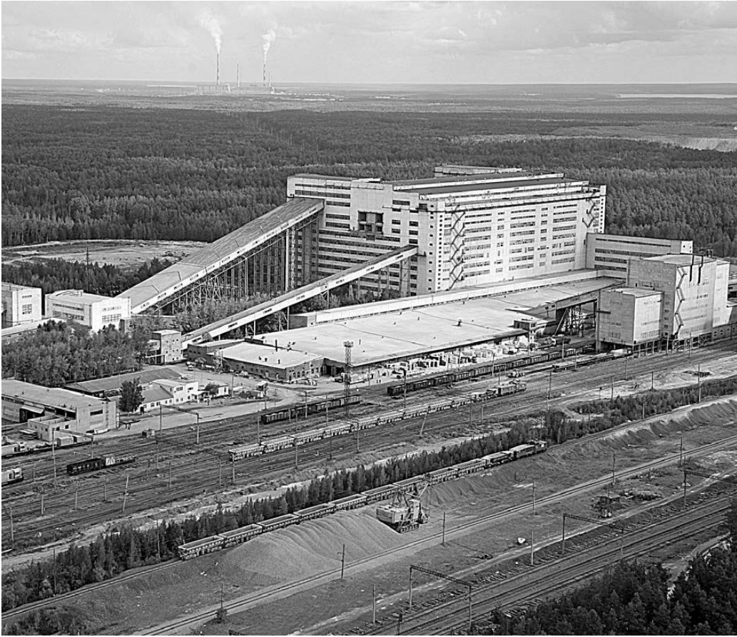
ПРЕСС-СЛУЖБА КОМБИНАТА «УРАЛАСБЕСТ»

На полную мощность работают две линии по выпуску базальтовой изоляции на заводе по производству теплоизоляционных материалов (ТИМ). Материалы марки «ЭКОВЕР» хорошо известны строителям России и Казахстана, недавно полученный в Праге международный сертификат соответствия открывает дорогу и на европейский рынок. Наша изоляция очень популярна не только благодаря конкурентоспособной цене, но такому важнейшему качеству, как негорю-