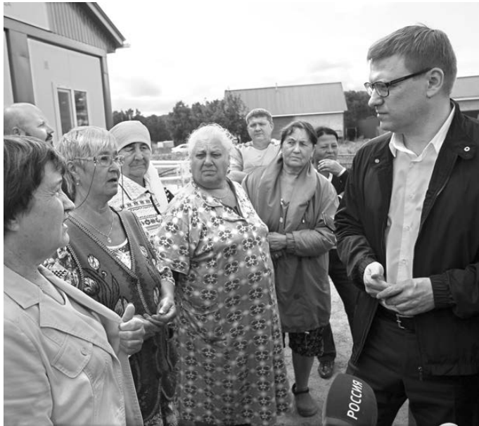
Глава Челябинской области Алексей Текслер (справа) уверен: реализация нацпроектов послужит повышению качества жизни всех южноуральцев.

— Сегодня мы имеем пообъектный список домов, подтверждающий планируемые объемы индустриального строительства жилья. Согласно действующим разрешениям в стадии строительства находятся многоквартирные дома жилой площадью 2382 тысячи квадратных метров. С учетом индивидуального жилищного строительства (около 1,6 миллиона квадратных метров в течение трех лет) планы будут выполнены, — заверил он. — Кроме того, область обязалась в срок до 1 сентября 2025 года расселить аварийный жилищный фонд в объеме 188,03 тысячи квадратных метров, улучшив жилищные условия 10,46 тысячи человек. ●