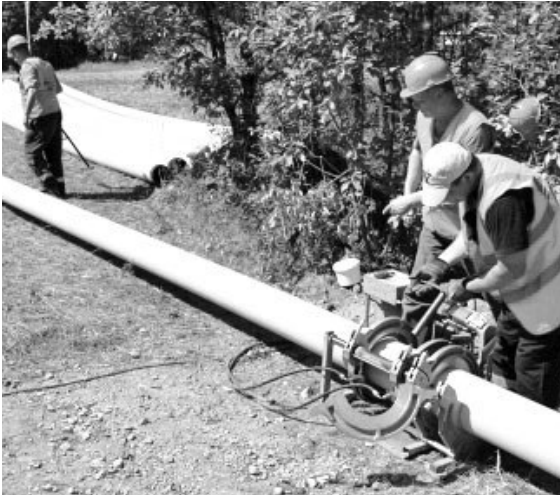
Методом реновации в этом году под Курганово заменят 1,5 километра газопроводов высокого давления. Если эксперимент признают удачным, его распространят на другие территории.

В этом году в модернизацию и развитие газового хозяйства на западе региона «ГАЗЭКС» инвестирует 100 миллионов рублей. Работы пройдут на 13 объектах в Сысерти, Полевском, Ревде и Первоуральске.