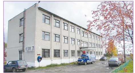
Бывшее здание конторы совхоза им. Ленина

Предприятие также занимается растениеводством, главным образом стараясь обеспечить кормами животных. Отрасль животноводства в полном объеме обеспечена грубыми и сочными кормами собственного производства. В 2018 г. произведено валовой продукции в действующих ценах на сумму 79 млн. руб., что составило 103% к уровню 2017 г.