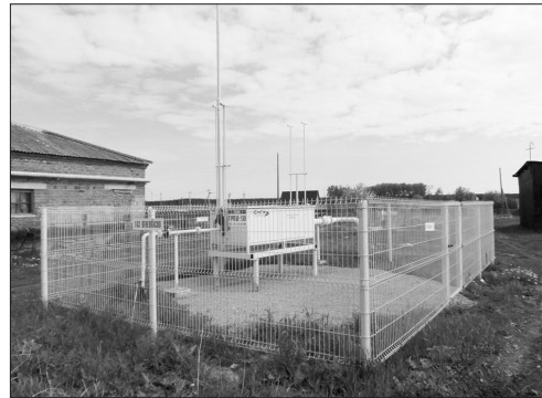
Газ в селе – комфорт для жителей

P.S. Когда верстался номер, стало известно, что на газификацию Колчедана выделено в этом году 3 млн 259 тыс. руб. Как и планировалось, работы по строительству нитки начнутся в августе 2019 г., а закончатся в 2020 г. В зону газопровода длиной 4,5 км попадут шесть улиц и один переулок. Принято решение и в отношении жителей Брода, на строительство газопровода длиной 4 км в этом населенном пункте выделено 7 млн 066 тыс. руб.