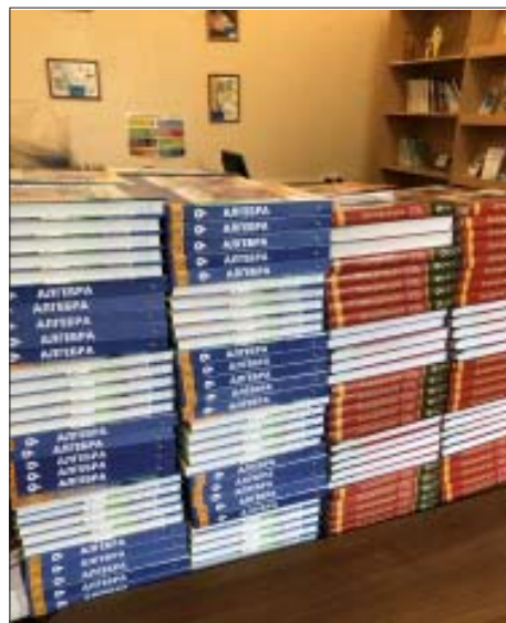
Учебники скоро окажутся в портфелях.