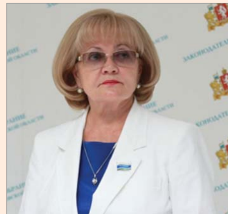
Л.В. БАБУШКИНА, председатель Законодательного Собрания Свердловской области

От всей души желаю всем вам, уважаемые огнеупорщики, новых трудовых свершений, эффективной технологической модернизации, достижения самых высоких производственных стандартов, дальнейших успехов на благо России и Свердловской области!