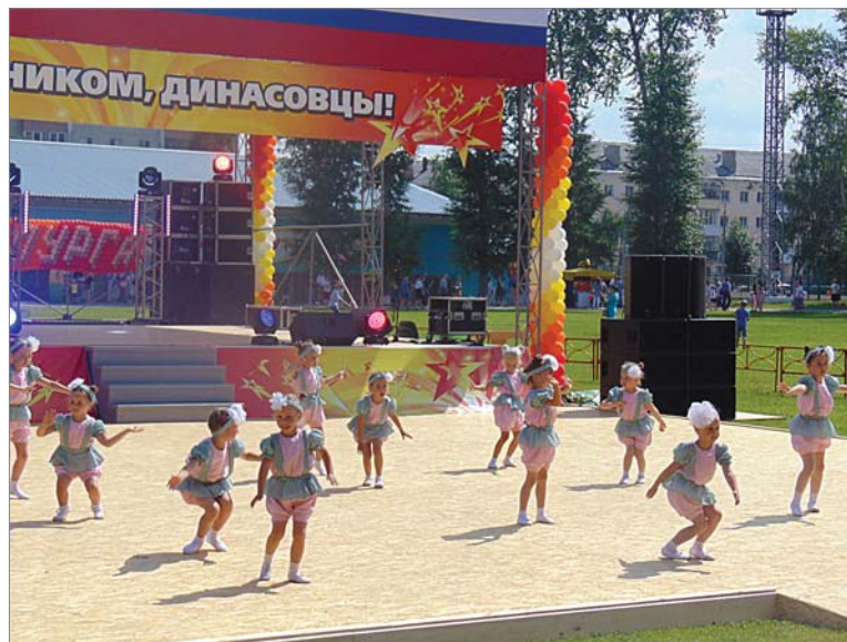
«Пятнашки» - с танцем «Лялечка».