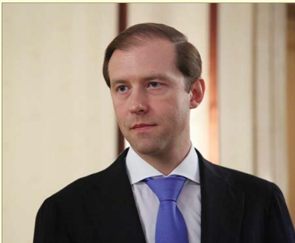
Д.В. МАНТУРОВ, министр промышленности и торговли РФ

Желаю всем металлургам крепкого здоровья, хорошего настроения и новых профессиональных успехов!