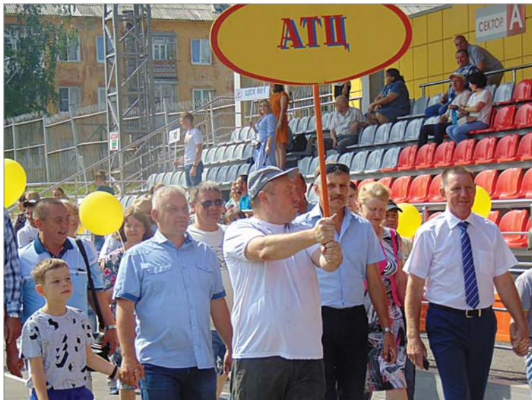
В праздничной колонне – автотранспортники, победители трудового соревнования.