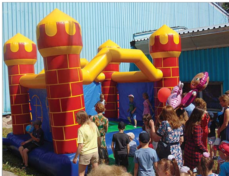
В очередь - на батут.