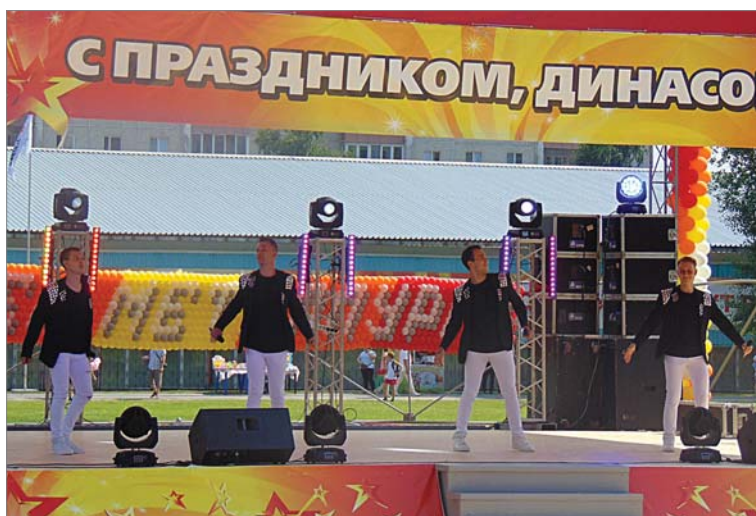
Заводчан поздравили вокалисты из Екатеринбурга - группа «Sample».