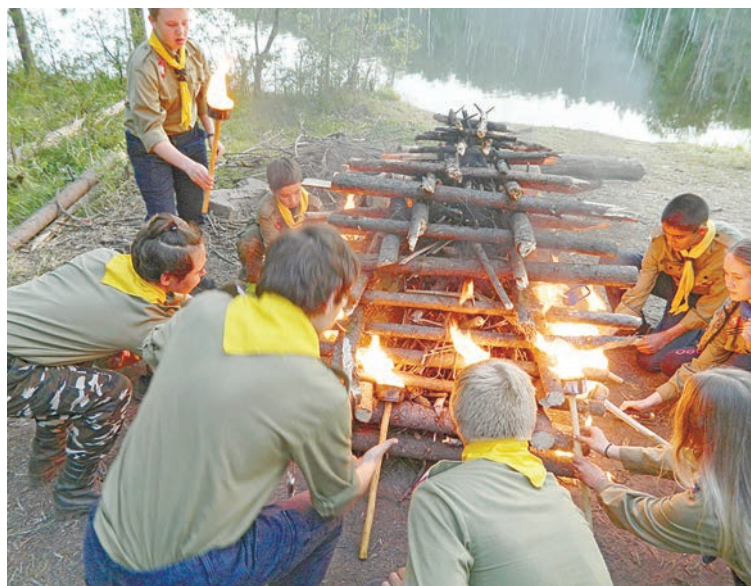
Какой поход без костра?

Ежедневная насыщенная программа скаутского лагеря вносила особый колорит и новые знания в жизнь каждого скаута-разведчика.