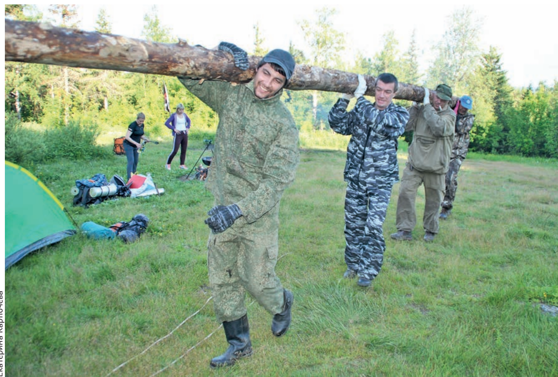
Новые опоры почти готовы!