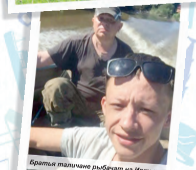
Братья таличаны рыбачат на Иртыше