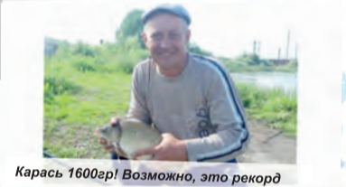
Карась 1600гр! Возможно, это рекорд