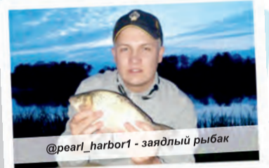
@pearl_harbor1 - заядлый рыбак