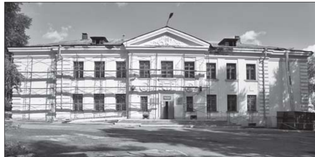
Школа № 15 в строительных лесах