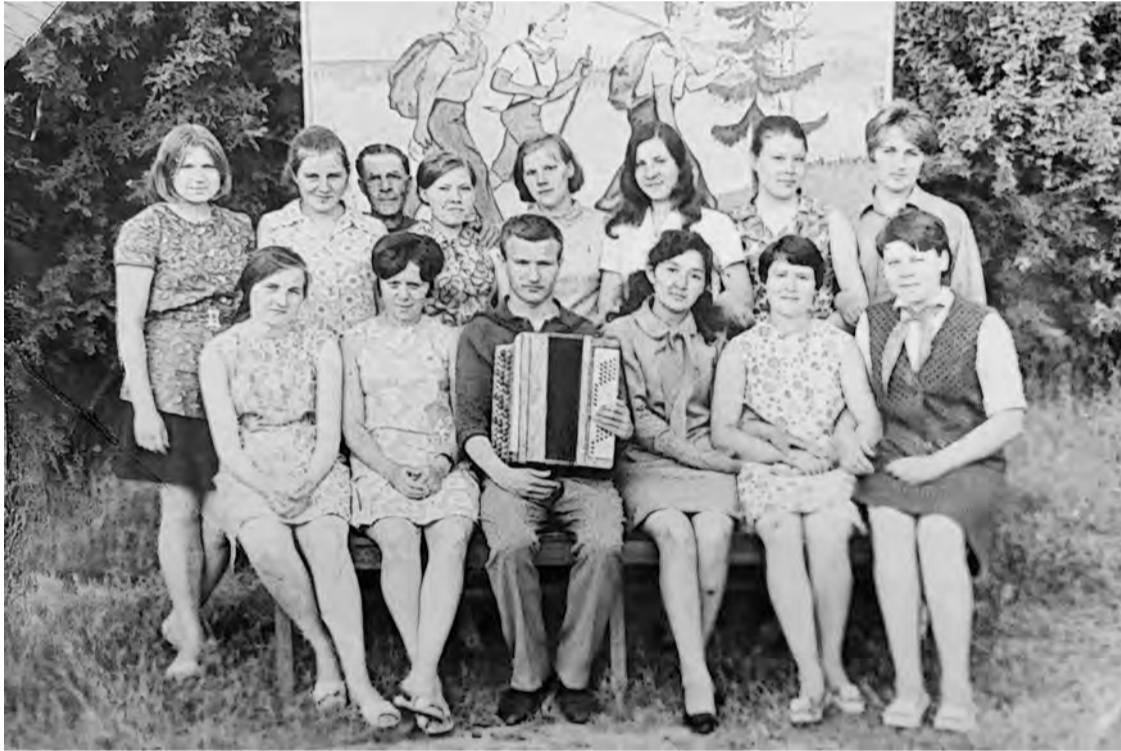
В лагере «Дружба» от БХЗ, 1971 год