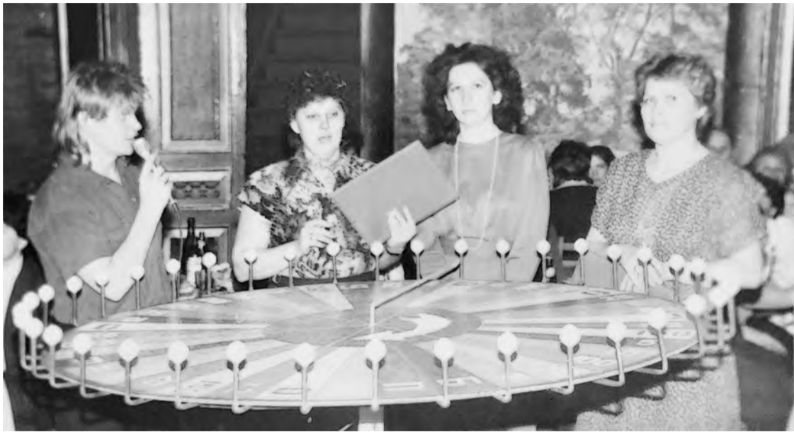
«Поле чудес» в клубе БХЗ, 80-е годы

Каждая фотография должна сопровождаться информацией о том, когда и где она сделана, что на ней изображено (или кто изображен), от кого получена.