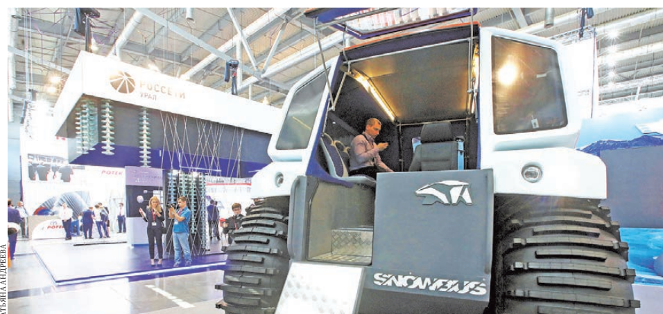
Компьютер беспилотного вездехода видит на 100–200 метров вперед.

В установке использованы кофе-машина и все необходимые приспособления для приготовления напитка. Ценность робота в том, что он всегда варит отличный кофе, ошибок у него не бывает. Правда, чтобы составить алгоритм его работы, потребовалась помощь настоящего бариста — призера профессиональных конкурсов. Стаканчик латте для корреспондента «РГ» робот сварил ровно за две минуты. На наш взгляд, напиток получился вкусным.