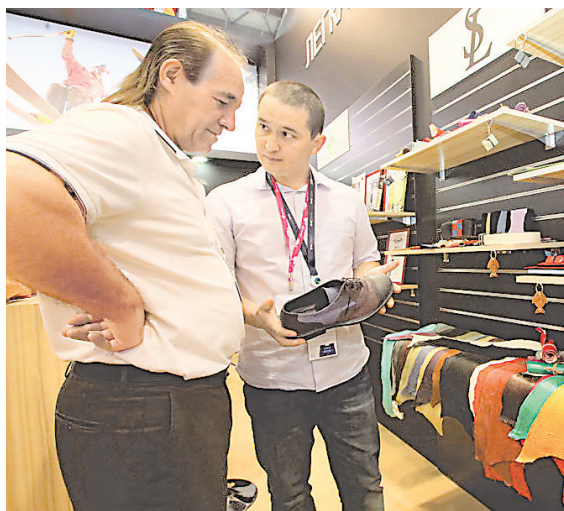
Кожа рыбы дешевле кожи рептилий, но выглядит так же дорого и изысканно.

Что интересного показали на Иннопроме-2019