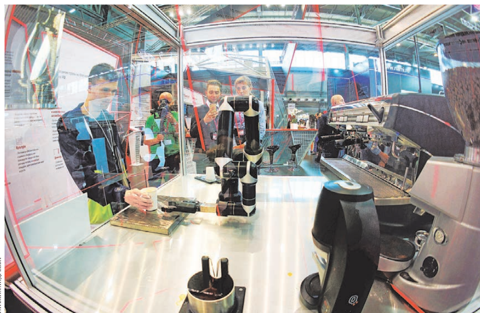
Робот-бариста никогда не допустит ошибку в приготовлении кофе.

Трактор видит препятствие — для этого он оснащен особыми камерами. Точность работы обеспечивает система коррекции спутникового сигнала — в результате максимальная погрешность движения составляет всего 10 сантиметров. Впрочем, совсем без гомо сапиенс трактор не обойдется, ведь