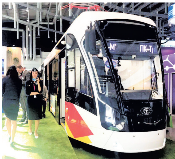
Перед препятствием трамвай автоматически остановится.