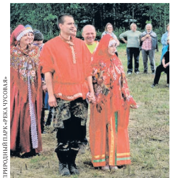
На фестиваль «Дух Урала» молодые люди пришли в аутентичных костюмах.