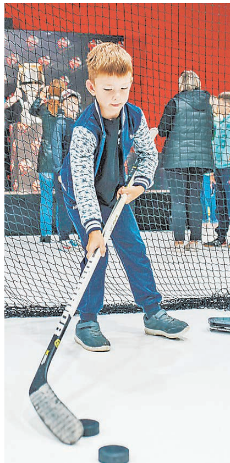
«NN CENTER» станет стартовой площадкой для юных хоккеистов.

— Важно, чтобы ребята не теряли связь со звездами хоккея. Живут где-то в Вашингтоне известные спортсмены, а на Южном Урале тысячи пацанов считают их небожителями. А если легенды спорта окажутся среди мальчишек, те будут рваться вперед, понимая, что у них есть реальный шанс стать такими же звездами. Рынок хоккея в Челябинске, пожалуй, сегодня самый крупный. Думаю, как только начнется учебный год, центр заполнится мальчишками и девочками. Благо, в городе есть люди, прошедшие школу «Трактора», есть очень сильные хоккеисты, владеющие методиками и навыками. И тогда в