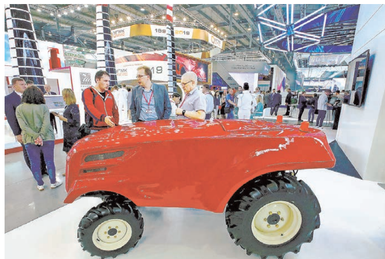
Беспилотный трактор способен накапливать знания.