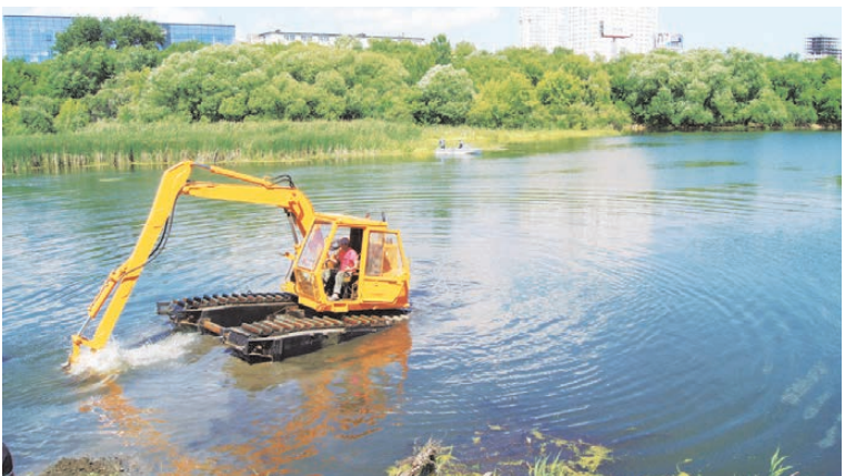
Плавающие экскаваторы избавят Миасс от водорослей и мусора.