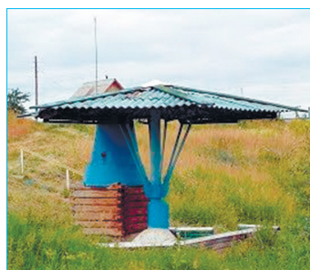
Фото с сайта ok.ru/kamenskyurbandistrict