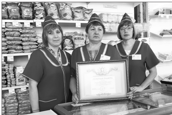
Коллектив продуктового магазина в Клевакинском награжден за хорошую работу

По пути в Клевакинское мы заехали в мастерские ПАО «Каменское», чтобы вернуть генератор. Оказывается, практически каждый рабочий день руководителей РайПО начинается с телефонограмм об отключении электроэнергии в разных концах района, на которые нужно очень оперативно реагировать. То есть срочно развезти бензиновые генераторы в магазины, попавшие в зону обесточивания. Иначе их работа будет парализована: нет электричества – не работают кассы, холодильные камеры, нет света. Значит, люди останутся даже без молока и хлеба, какие-то продукты попортятся, не будет выручки. Энергетики же не церемонятся, как правило, отключают электричество вразброс. Вот и приходится метаться по всему району. Когда не хватает собственных семи генераторов, выручает ПАО «Каменское», поясняют собеседники. Это одна из реалий, в которых сегодня приходится работать кооператорам.