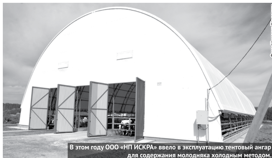
В этом году ООО «НП ИСКРА» ввело в эксплуатацию тентовый ангар для содержания молодняка холодным методом.