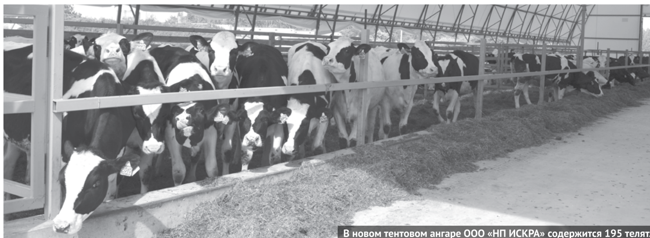
В новом тентовом ангаре ООО «НП ИСКРА» содержится 195 телят.