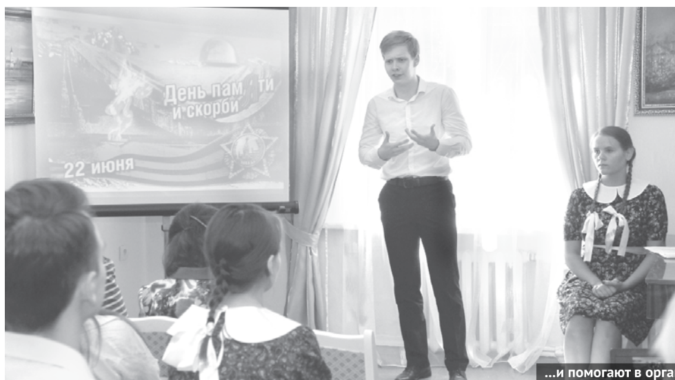
...и помогают в организации мероприятий.

Впечатлений у ребят масса, очень их удивило то, что наши учреждения культуры взаимодействуют друг с другом, работают, как единый организм. Гости-практиканты рассказали, что будут продолжать свое обучение по театральной линии, но такая практика - бесценный опыт, который пригодится в жизни. А еще асбестовцам понравился наш край, что особенно приятно.