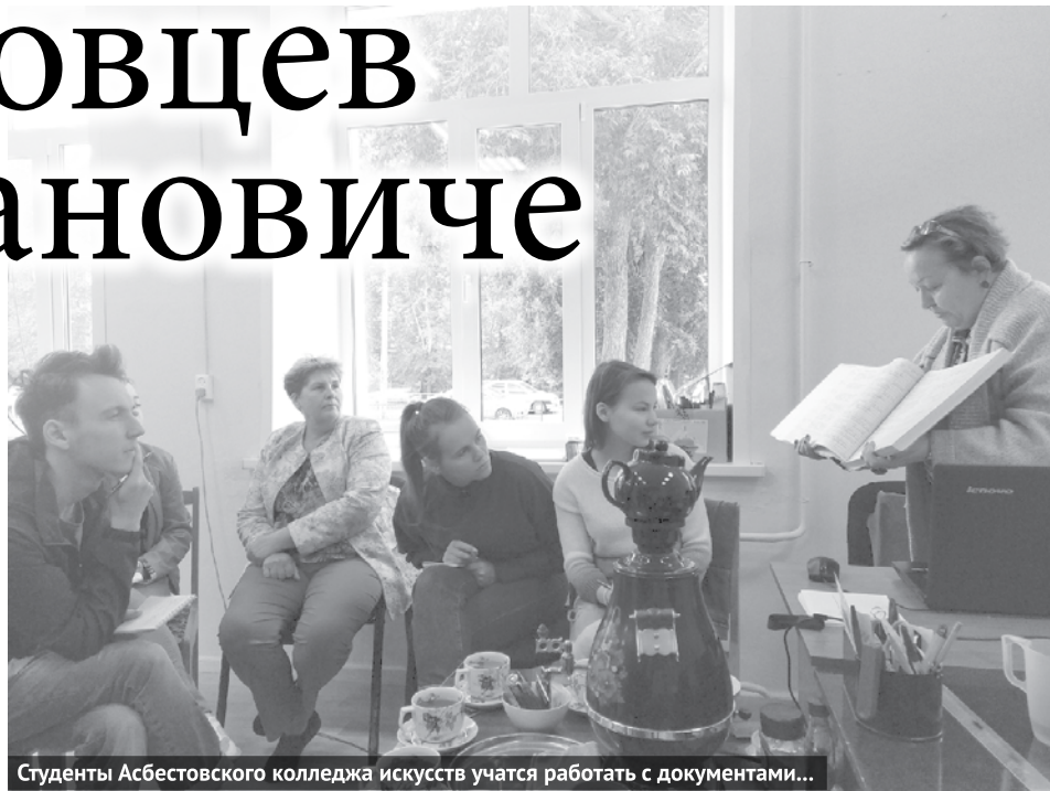
Студенты Асбестовского колледжа искусств учатся работать с документами...

В рамках проекта «РасКАДРовка», реализуемого центром современной культурной среды ГО Богданович и Асбестовским колледжем искусств, для прохождения практики в Богданович приехали студенты третьего курса колледжа