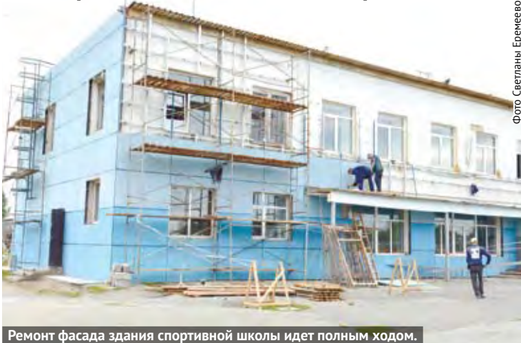
Ремонт фасада здания спортивной школы идет полным ходом.

В спортивной школе по хоккею с мячом полным ходом идет ремонт. На сегодняшний день проделан большой объем работы