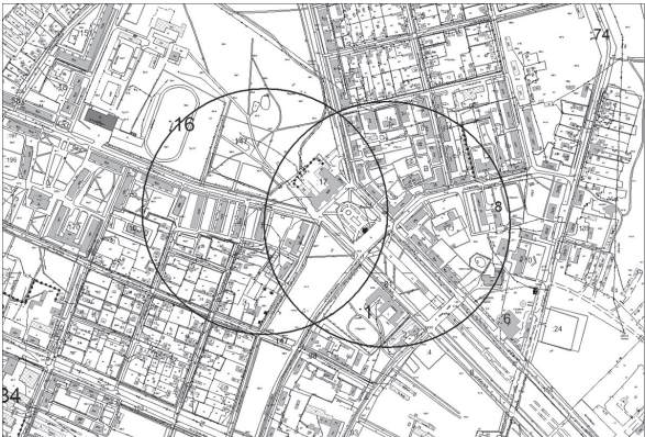
Приложение № 1 к постановлению администрации городского округа Красноуральск № 848