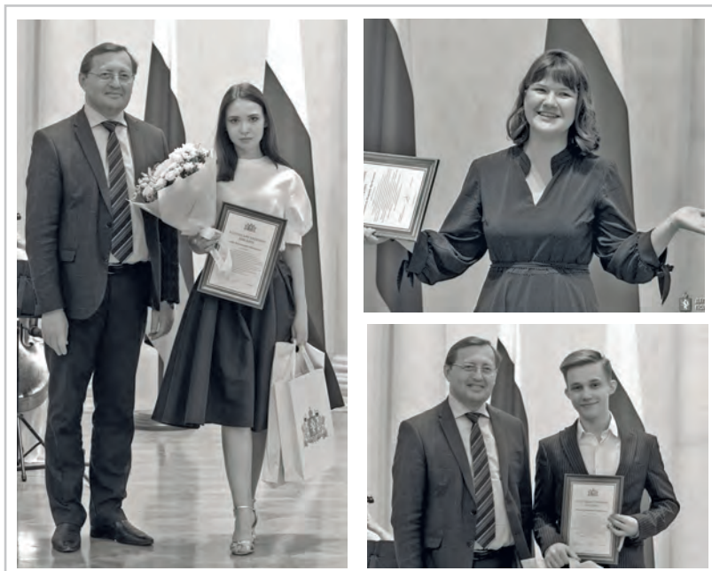
● Чествование в резиденции губернатора лучших выпускников Свердловской области