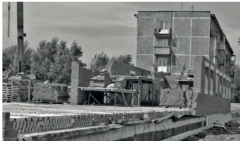
● Возведение первого этажа нового дома по улице Тимирязева