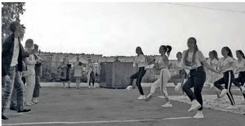
● День молодёжи в Бисерти