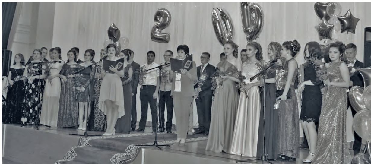
● Выпускной вечер в 11-х классах школы № 1