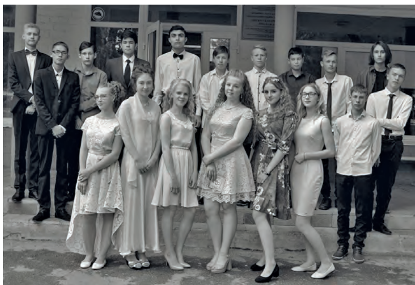
● Выпускники 9 класса школы № 2

Школьники - ученики девятих и одиннадцатых - Бисертского городского округа отмучались (как они пока наивно полагают) и завершили обучение в средней школе.