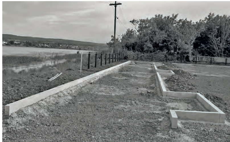
● Устанавливается бордюрный камень пешеходных дорожек в будущем сквере на набережной