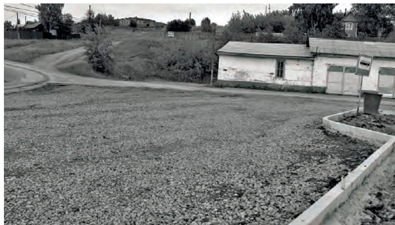
● Дорога на набережной готова к асфальтированию