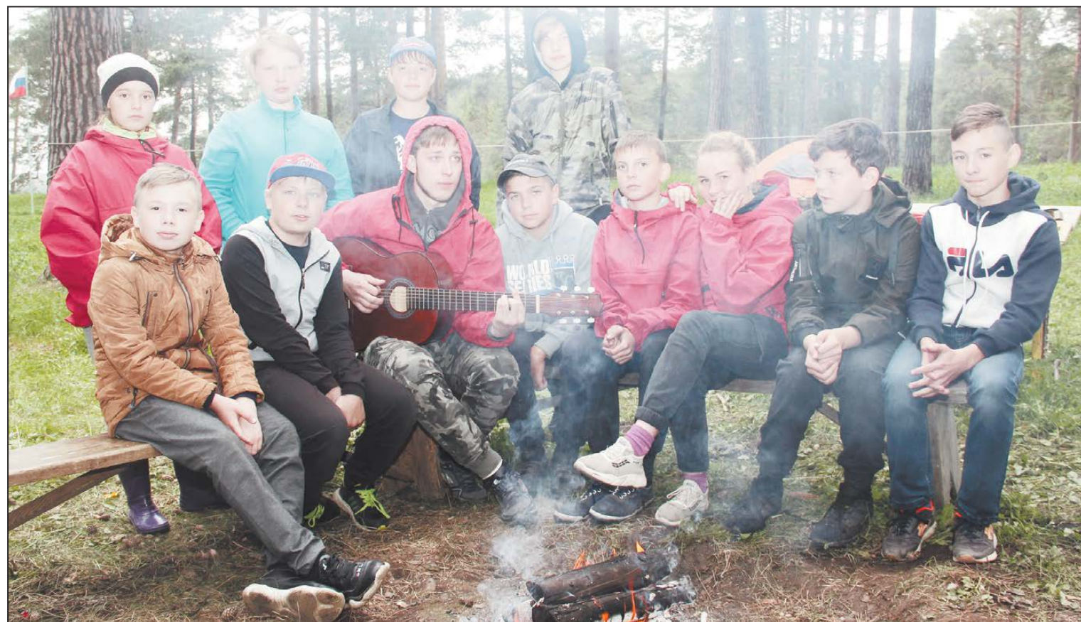
Команда «Вертикаль» (ЦДО) не новичок в туристском деле

Но эти дни пролетели, как один миг. Настал момент подведения итогов. Результаты распределились следующим образом: в зачетном соревно-