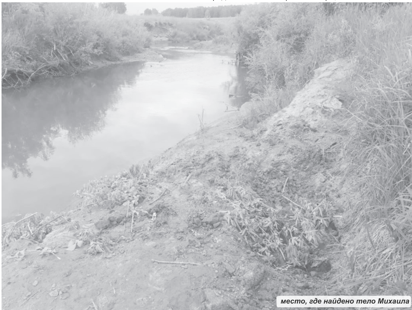
место, где найдено тело Михаила

Полоса подготовлена при финансовой поддержке Федерального агентства по печати и массовым коммуникациям