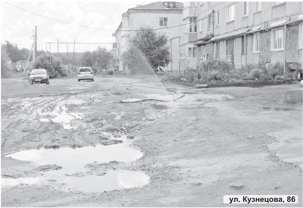
ул. Кузнецова, 86

на территории города - такое не под силу Управлению городского хозяйства!