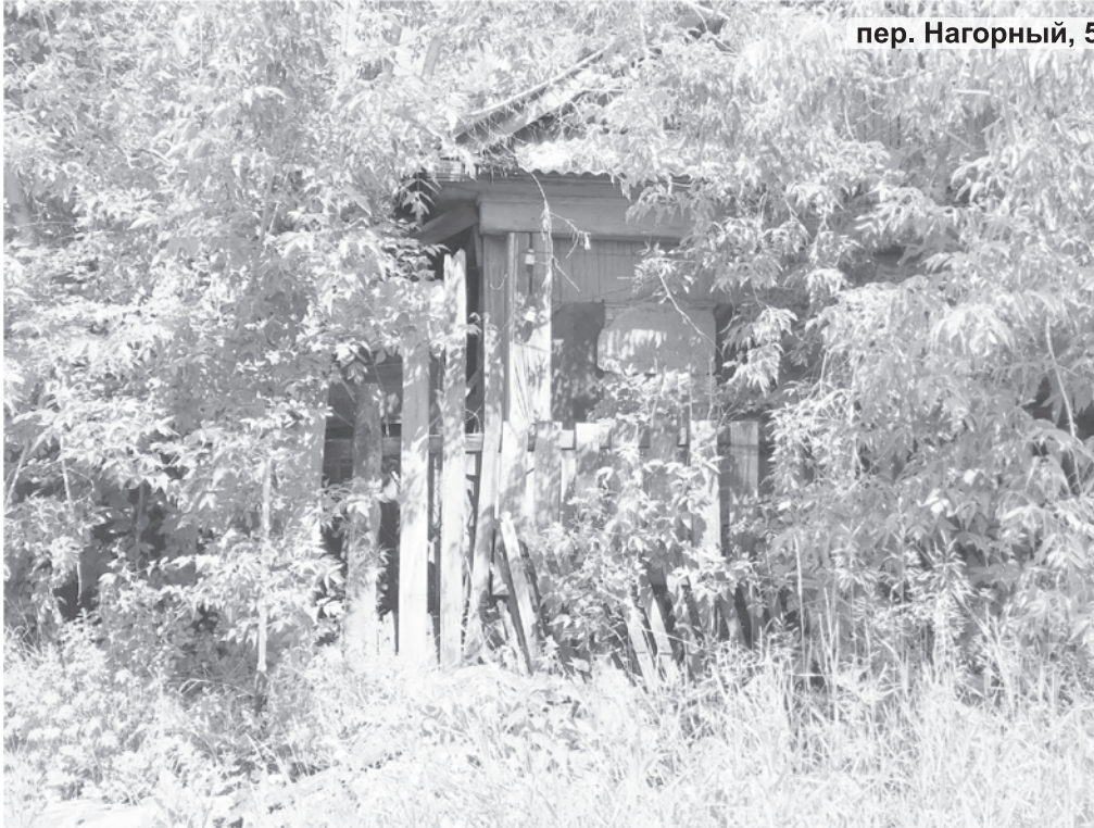
пер. Нагорный, 5

Так председатель уличного комитета с ул. Кирова пожаловалась, что еще год назад через МФЦ оформила заявку на спил деревьев по пер. Нагорный, 5. Дом много лет необитаем, все разрушено, заросло травой, деревья выше дома. Страшно даже проходить рядом, опасно. Женщину интересует: неужели нет такого закона, чтобы обязывать собственников наводить порядок на своей придомовой территории? По ее словам, подобная картина и на углу улиц Кирова - Исламова.